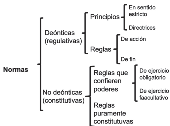
Cuadro 2. Reglas y principios

o normas programáticas —mandatos que establecen la obligación de procurar obtener objetivos económicos, sociales, etcétera, fijados de manera muy genérica—. 21 Existe cierto paralelismo entre los principios en sentido estricto y las reglas de acción, por un lado; y las directrices y las reglas de fin, por otro. El siguiente cuadro muestra esta muy conocida clasificación: