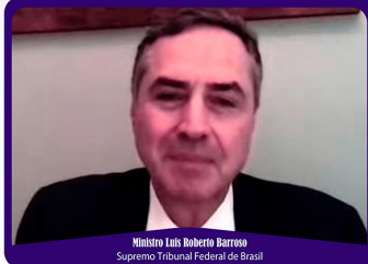
Ministro Luis Roberto Barreto Supremo Tribunal Federal de Brasil