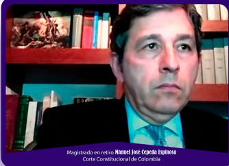
Magistrado en retiro Manuel José Cepeda Espinosa Corte Constitucional de Colombia