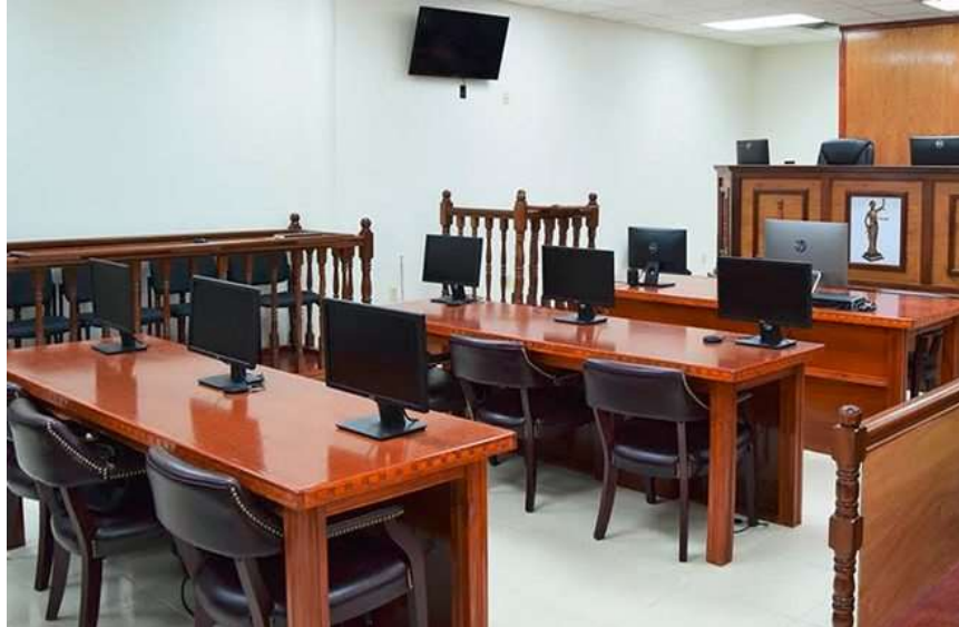
La Segunda Sala