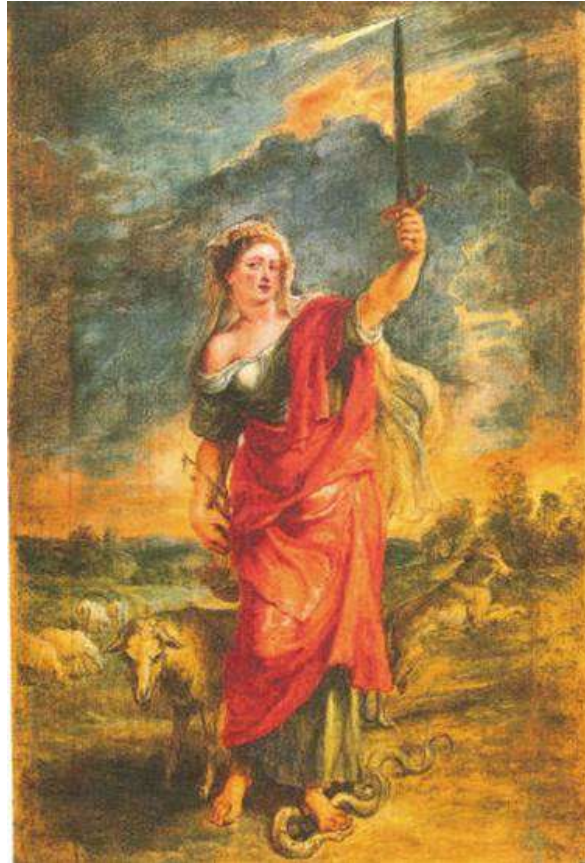
Obra de Peter Paul Rubens (1625)