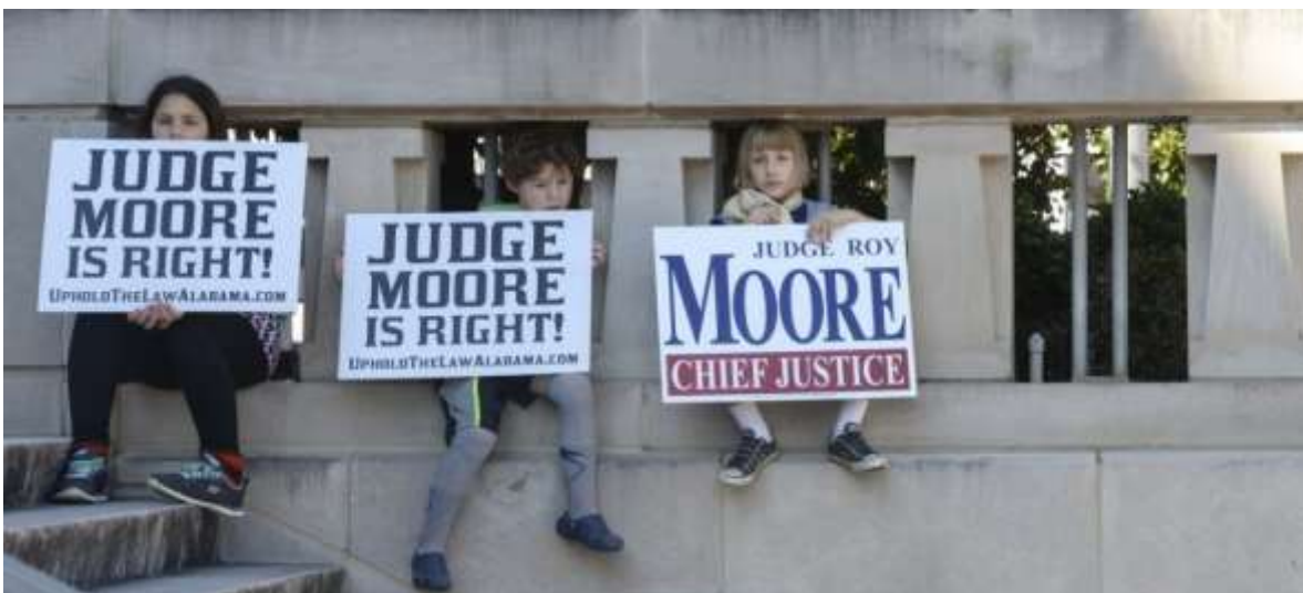
Tres simpatizantes de Roy Moore muestran su apoyo