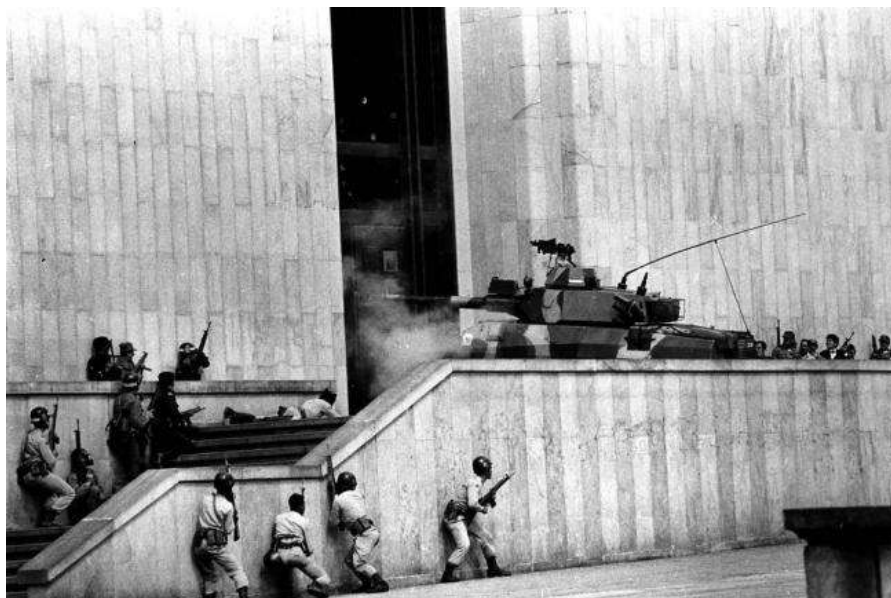
Noviembre de 1985: la toma del Palacio de Justicia

este . En diciembre del 2014, la Corte Interamericana de Derechos Humanos condenó al Estado colombiano por la desaparición de 11 personas y la retención ilegal y tortura de otros cuatro civiles en el Palacio de Justicia. La sentencia del organismo internacional indica: "Los sospechosos eran separados de los demás rehenes, conducidos a instituciones militares, en algunos casos torturados, y su paradero posterior se desconocía". Además, para la Corte IDH quedó probado que "bajo la dirección de funcionarios militares, las autoridades alteraron gravemente la escena del crimen y cometieron múltiples irregularidades en el levantamiento de los cadáveres". Por eso, el Estado colombiano fue declarado responsable internacionalmente "por ciertas violaciones de derechos humanos cometidas en el marco de los sucesos conocidos como la toma y la retoma del Palacio de Justicia" y por faltar a su deber de garantizar el derecho a la vida.