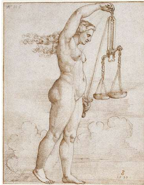
Grabado de Georg Pencz, 1535.