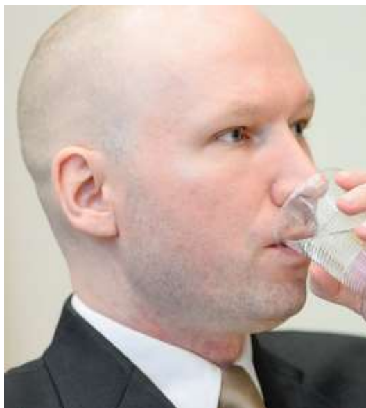
Anders Behring. Cerrada la vía judicial en Noruega

condenado en 2012 a 21 años prorrogables de forma indefinida por hacer estallar en el complejo gubernamental de Oslo una furgoneta bomba que mató a ocho personas. Luego, se trasladó en coche a la isla de Utøya, al oeste de la capital, donde perpetró una matanza en el campamento de las Juventudes Laboristas en la que murieron otras 69 personas.