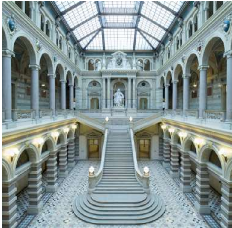
Austria, Palacio de Justicia