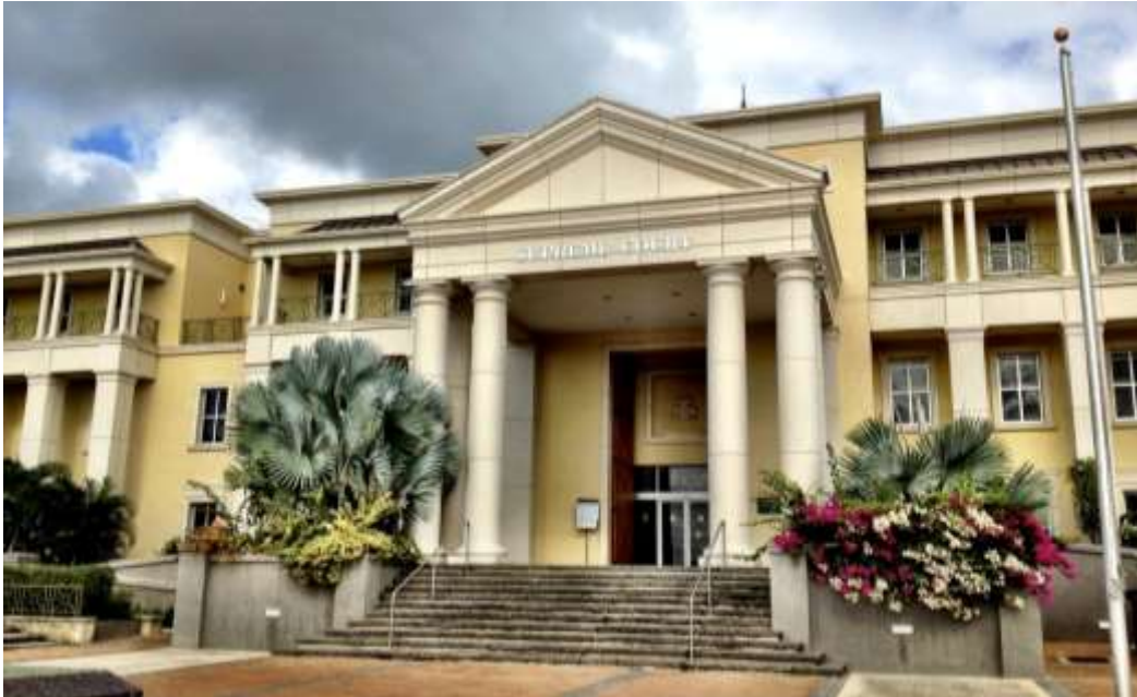
Barbados, Suprema Corte