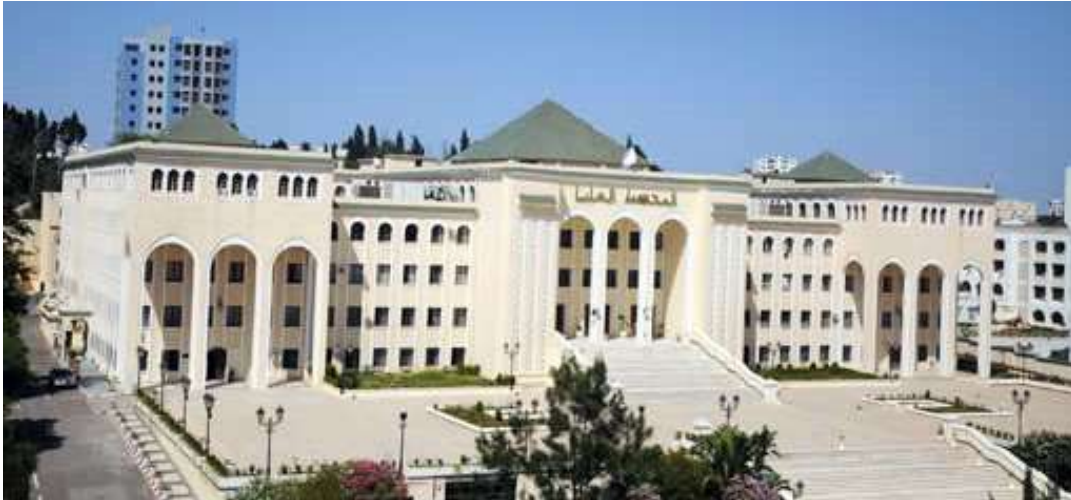
Argelia, Corte Suprema