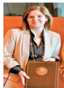
Foto: Especial Pilar Cancela, del Ministerio de Asuntos Exteriores español.

En el primer viaje oficial de la SECI a México, la funcionaria conoció distintos