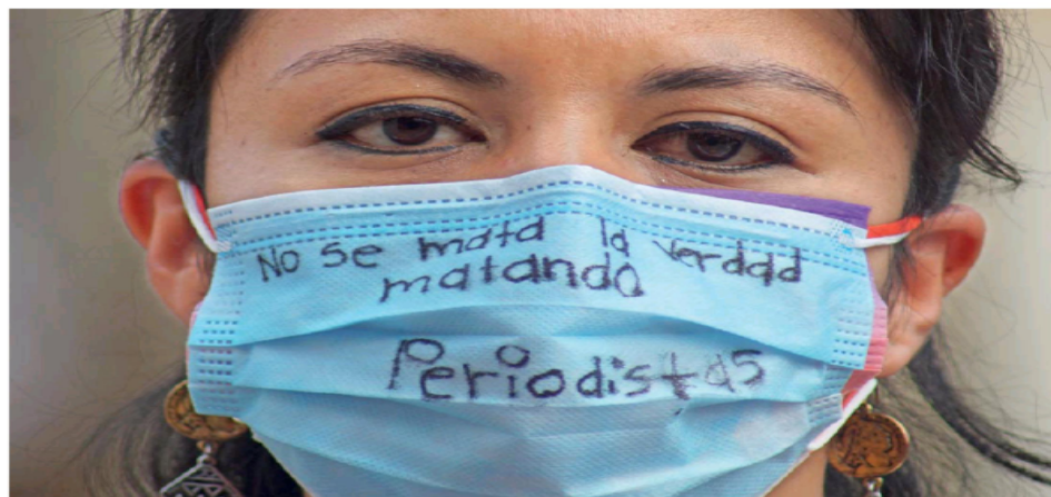
EDITH REBOLLO/EL UNIVERSAL