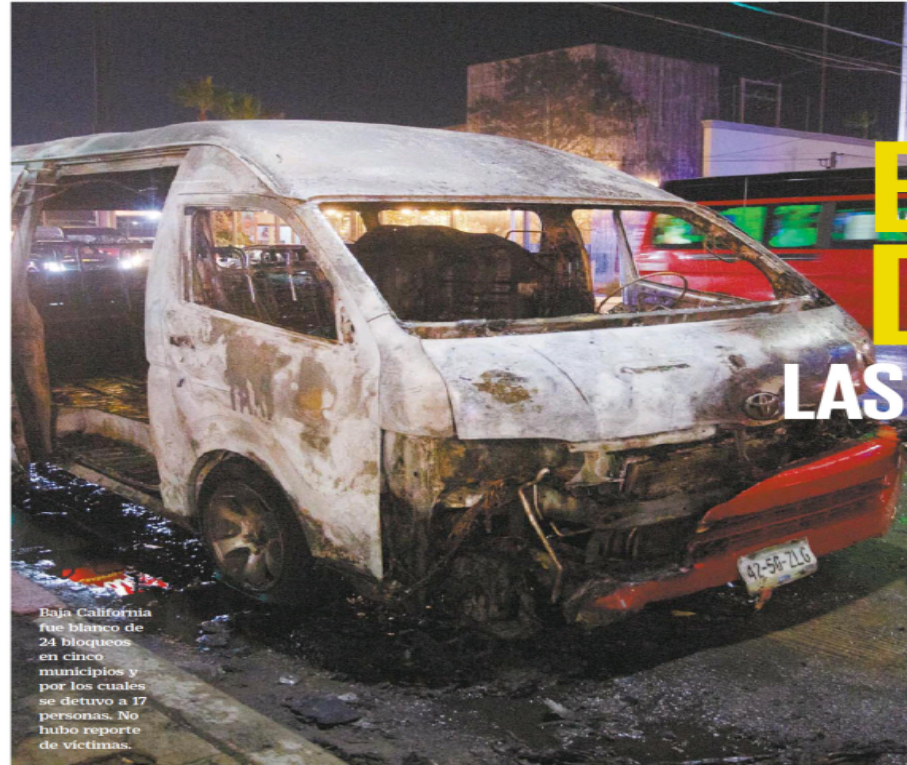
Baja California fue blanco de 24 bloqueos en cinco municipios y por los cuales se detuvo a 17 personas. No hubo reporte de víctimas.