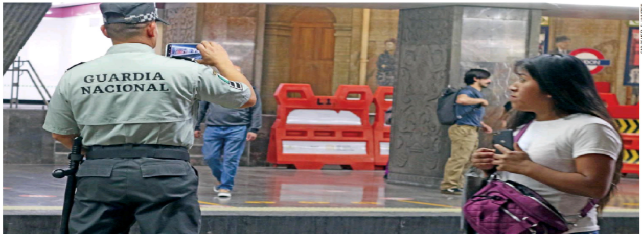
CALOS MEJA / EL UNIVERSAL