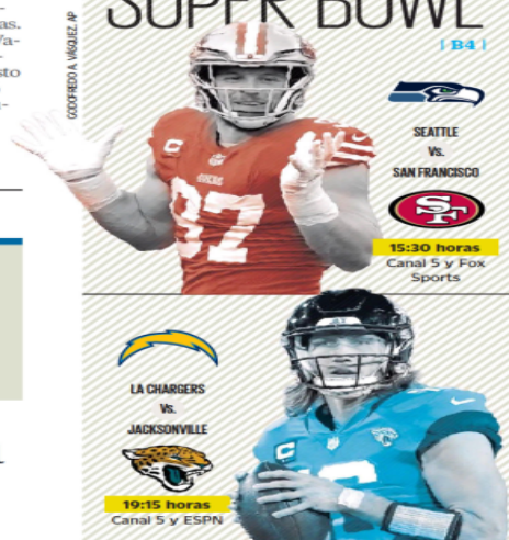
GOFFRED A. WAGNER / AP