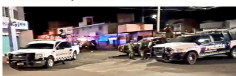
Personal militar llegó al lugar minutos después del crimen.

En Tlalpan también se compraron los vehículos de emergencia y se usan hasta sin placas; sólo tienen un registro interno.