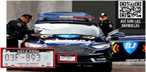
Las patrullas de BJ traen placas de auto particular.

Grupo REFORMA constató en un recorrido que una de las patrullas de Tlalpan fue usada para transportar desechos a la Alcaldía.