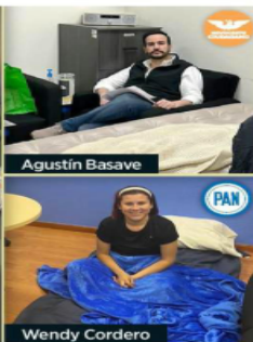
Diputados opositores durmieron en el recinto legislativo.