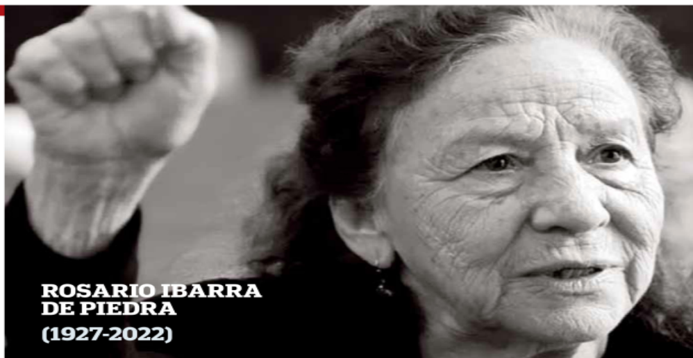
ROSARIO IBARRA DE PIEDRA (1927-2022)