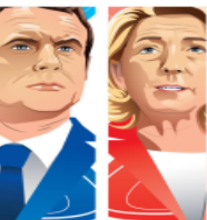
Ilustración: Abraham Cruz