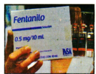
AFIRMAN ESPECIALISTAS QUE NO es factible sustituir el fentanilo de uso médico.

Es usado como calmante para pacientes oncológicos con dolores severos, sustituyendo a la morfina que tiene más efectos colaterales