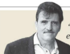
Enrique Serna "Pacheco, Monsiváis y el arte de la persuasión a la japonesa" - P. 29

Estudio. Con base en estadísticas de gobierno y organizaciones de EU, la SRE alega que solo 3 por ciento de detenciones involucra a los migrantes en ese contrabando