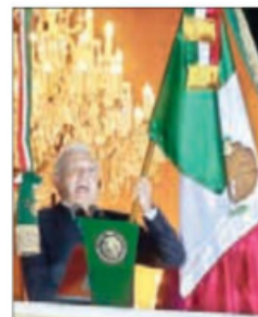
▲ El mandatario, en Palacio.

ALONSO URRUTIA, GUSTAVO CASTILLO Y EMIR OLIVARES / P 4 Y 5