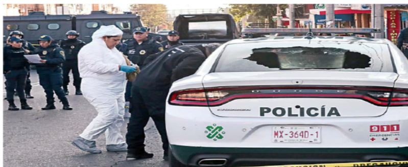
Peritos y policías llegaron a la colonia Arcos del Centenario, donde culminó la persecución.