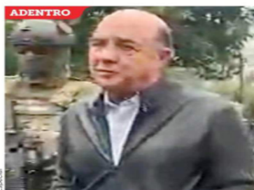
■ Jesús Murillo Karam fue detenido al salir de su casa en Las Lomas.

Murillo Karam no opuso resistencia y fue trasladado a la subde de la FGR en la