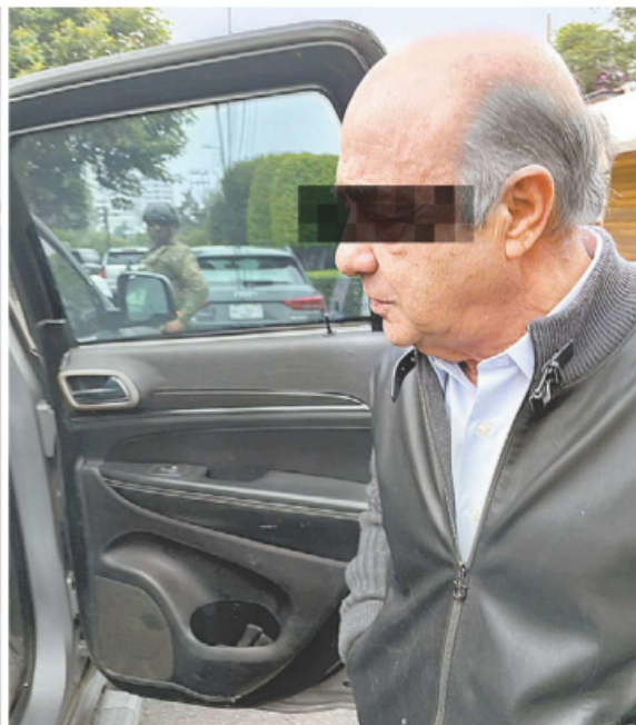
La ex titular de Desarrollo Social saliendo del penal de Santa Martha y el ex funcionario detenido en Las Lomas. JUAN C. BAUTISTA