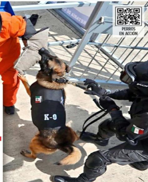
■ El equipo canino opera en prisiones de Estado de México.