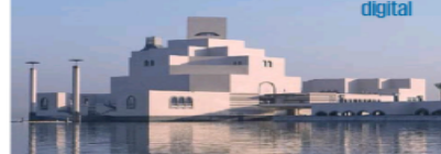
CORTESÍA DEL MUSEUM OF ISLAMIC ART