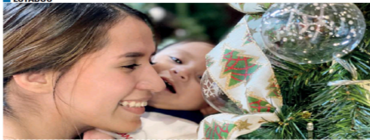
CARLOS ARETIA/EL UNIVERSAL