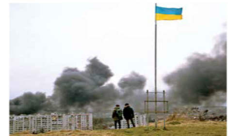
Los cohetes rusos impactaron un depósito de combustible en una ciudad que había estado fuera la lupa de las tropas rusas.