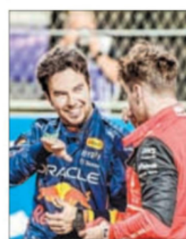
▲ Checo Pérez conversa con Charles Leclerc.