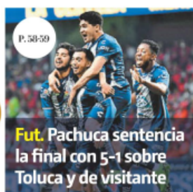
Fut. Pachuca sentencia la final con 5-1 sobre Toluca y de visitante

Meta se hunde en NY Musk paga 44 mil mdd por Twitter y emprende purga FINANCIAL TIMES - PAGES. 48 Y 49