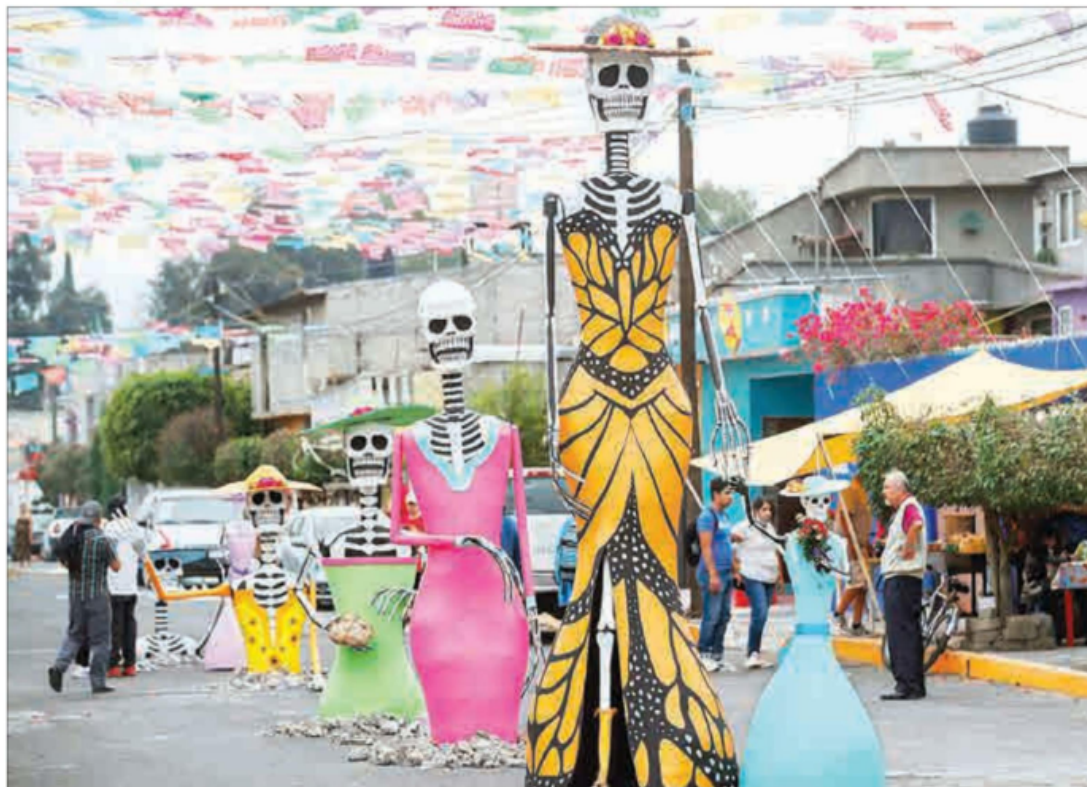
▲ Una idea que surgió en 2011 en la calle Francisco Santiago Borrás, colonia San Cecilia, se convirtió en tradición por los festejos del Día