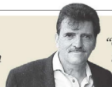
Enrique Serna "Cuando el traductor irrumpe tocando la pandereta" - P. 56

Congresos. Sonora aprobó el cambio para que las fuerzas armadas continúen en labores de seguridad pública hasta 2028, con lo que se llega a las 17 entidades a favor que requiere la reforma constitucional