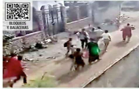
Habitantes de Frontera Comalapa, cerca de Guatemala, huyeron de sus poblados por los enfrentamientos de cárteles y el miedo a que los jóvenes sean reclutados.

Organizaciones civiles lanzaron un llamado a las autoridades para que se garantice la seguridad de los habitantes de los municipios de Frontera Comalapa, Chicomuselo, La Trinitaria y Amatenango de la Frontera.