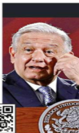
LOS DICHOS DE AMLO

claraciones "de ninguna forma pueden ser parte del ejercicio de comunicación de transparencia y rendición de cuentas. Por el contrario, éstas pudieran afectar la equidad en la contienda electoral o influir en las preferencias de la ciudadanía" en los procesos electorales de Coahuila y Estado de México.