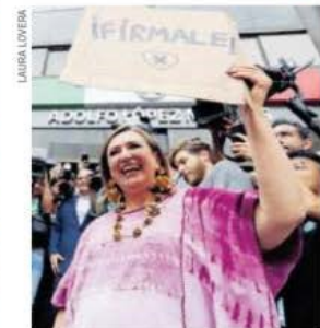
La Xochitlmania no la hará perder el piso, dice.

"Lo que le duele es que soy una persona del pueblo, a lo que él quiere llamarle pueblo, porque el pueblo para mí es todo México, donde caben los ricos, los pobres, los medianos, los muy ricos también, pero también los muy pobres", dijo quien busca ser la representante del Frente Amplio por México en la contienda de 2024. Pág. 18