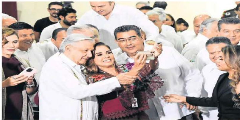
El presidente Andrés Manuel López Obrador rindió su informe en Campeche, en el que destacó los avances en materias económica, energética y de planes sociales; al finalizar se tomó fotos con gobernadores que asistieron al evento.

Dice que su modelo de desarrollo es eficaz e insiste en reforma para limpiar al Poder Judicial