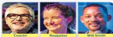
Cuarón, Reygadas y Will Smith

MILLONES DE ADULTOS mayores reciben $4,800 bimestrales de pensión.