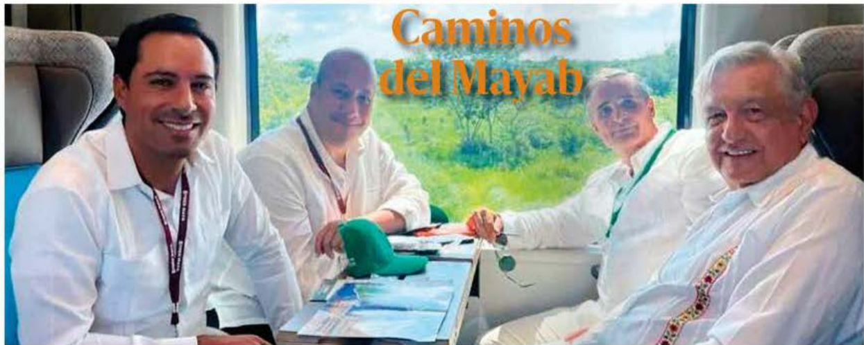
El presidente Andrés Manuel López Obrador inauguró el Tren Maya en un recorrido de reconocimiento entre Campeche y Mérida; estuvo acompañado por los gobernadores de Yucatán, Jalisco y Estado de México, Mauricio Vila (PAN), Enrique Alfaro (MC) y Alfredo del Mazo (PRI), respectivamente.