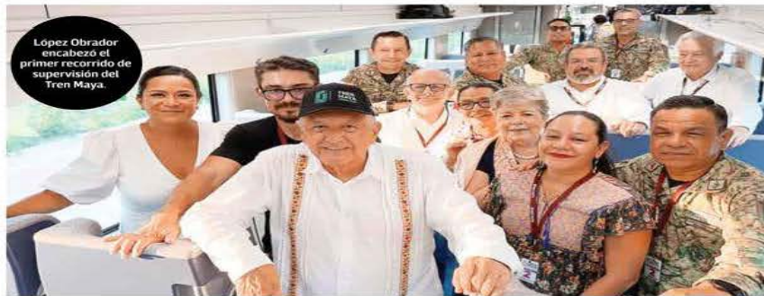
López Obrador encabezó el primer recorrido de supervisión del Tren Maya.

Por ello, recordó que enviará una iniciativa de reforma para que jueces, magistrados y ministros sean electos por voto directo y popular, y así limpiar al Poder Judicial “de complicidades, conflictos de interés, conivencias inconfesables, corrupción y derroche de recursos”.