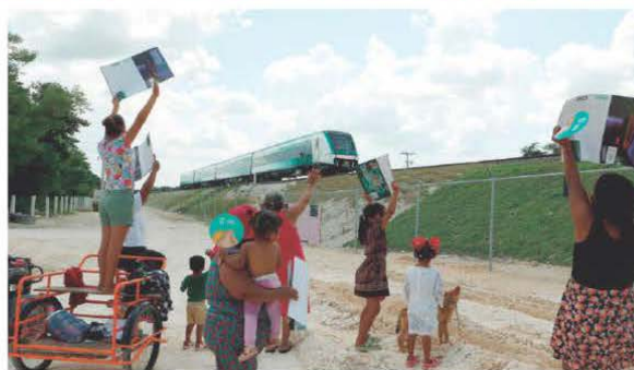
POBLADORES saludan el recorrido del Presidente en el llamado Jaguar Rodante, ayer.

FIJA entrega del Tren Insurgente, de Toluca, en septiembre 14; reactivación de Mexicana, en noviembre; reconoce apoyo de Sedena y Marina; va contra Poder Judicial. págs. 4 a 8