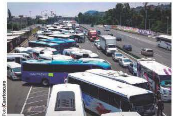
AUTOBUSES de Tizayuca, ayer, en el bloqueo.

BLOQUEAN desde las 5:00 horas la autopista; denuncian extorsiones e inseguridad; se forman filas de kilómetros; chocan con automovilistas y afectan a miles de pasajeros. pág. 12