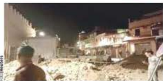
DAÑOS en Marrakech, ayer.

MOVIMIENTO de 6.8, el más severo en ese país, colapsa estructuras; registran 153 heridos; inicia rescate de personas atrapadas. pág. 13