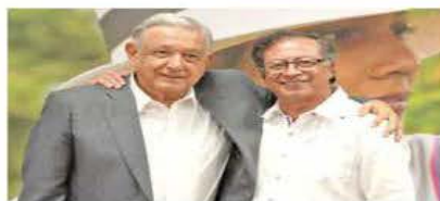
El Presidente de México se reunió ayer con su homólogo colombiano en la ciudad de Cali, en el inicio de su gira por Sudamérica.

INVENCION DEL YO La ensayista Andrea Wulf hurga en las ideas que formaron el significado moderno de la libertad. EXPRESIONES / 22