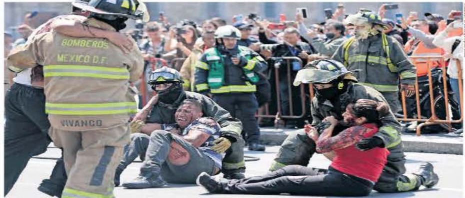
IMAGEN DEL DÍA SIMULACRO O SHOW?

Con motivo del aniversario de los terremotos de 1985 y 2017 se realizó una representación de labores de rescate en un sismo en el Zócalo capitalino, en el que participaron Marina y bomberos, en compañía de binomios caninos. | A16 |