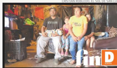
Familia del municipio de Guadalcázar en SLP

El Gobierno de la 4T asegura que 5.1 millones de personas dejaron de ser pobres, pero en la actualidad hay 9.1 millones de mexicanos que no pueden comprar la canasta básica y padecen carencias sociales, están en pobreza extrema