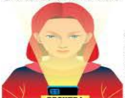
Ilustración: Arriana Cruz

Masajes, trabajos de limpieza, plomería o electricidad a domicilio: llegaron para quedarse al alcance de un clic. / 5