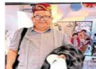
La parroquia compartió fotos del grupo en Estambul.