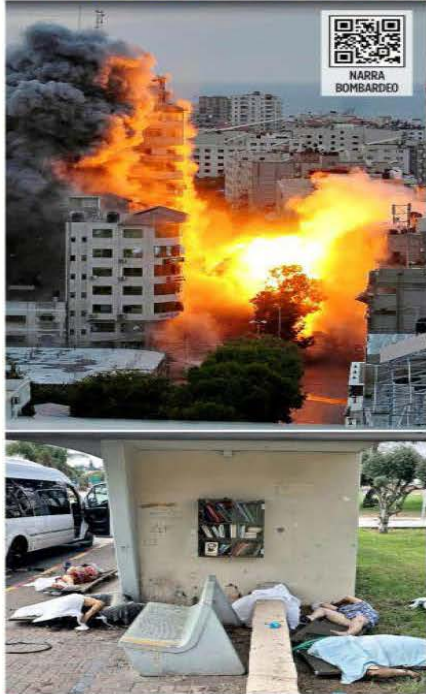
Hamás bombardeó territorio de Israel, que respondió con ataques a Gaza. Militantes del grupo islamista realizaron incursiones en las que mataron a civiles y militares israelíes.