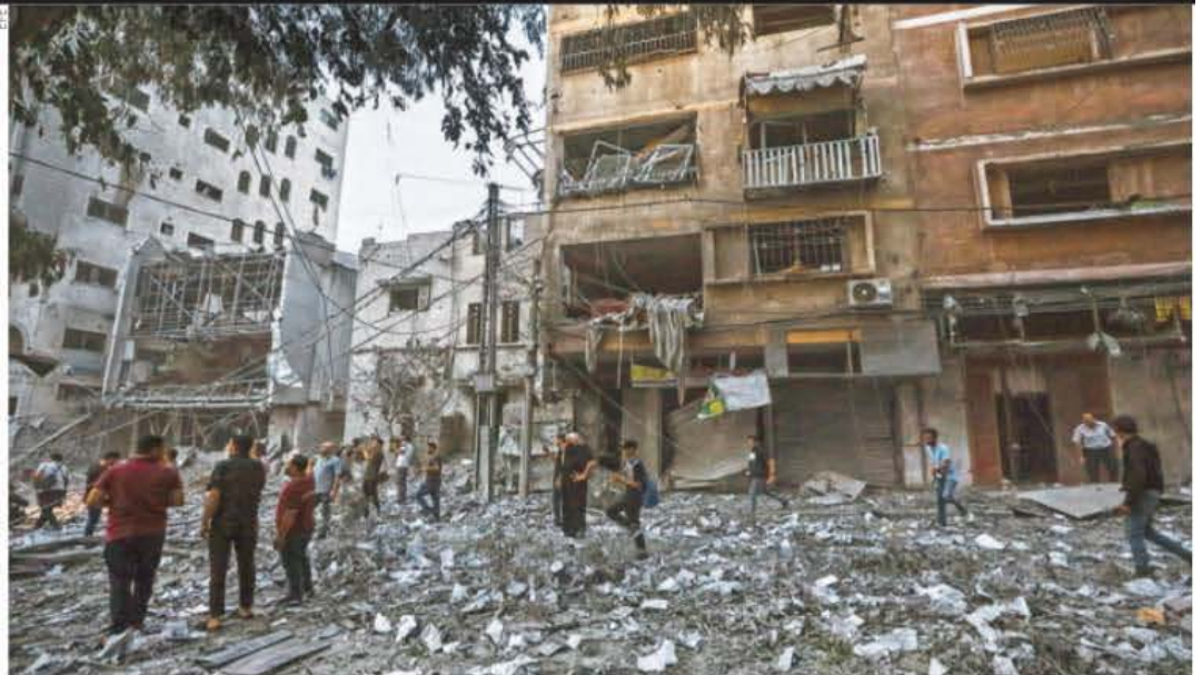
Palestinos observan en Gaza el impacto del ataque desde aviones de combate israelíes en represalia por la ofensiva de Hamas