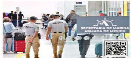
Miembros de la Marina están a cargo desde ayer de la vigilancia del aeropuerto capitalino.

Los militares están a cargo de la vigilancia, pero también de prestar ayuda a los pasajeros sobre la ubicación de un local, un banco, una aerolínea o los ingresos a las