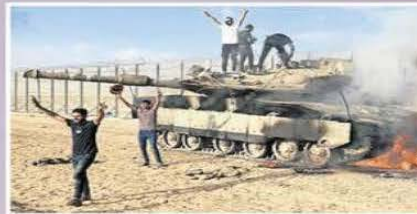
Un tanque israelí al lado de un tanque de Hamas destruido en una batalla en la Franja de Gaza, al norte de Khan Younis.