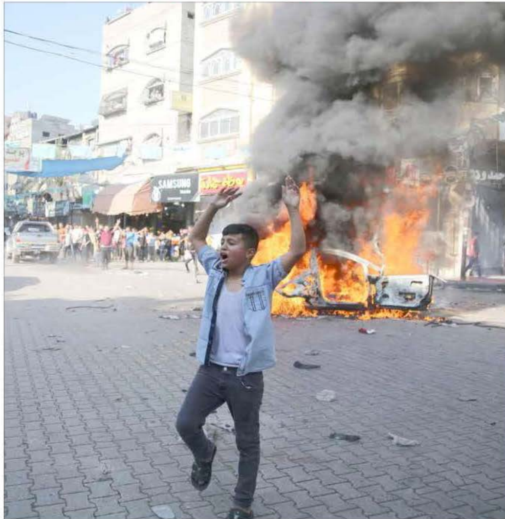
▲ El gobierno de Netanyahu respondió con lluvia de misiles y llamó a sus reservistas. En la imagen, palestinos celebran en Gaza.