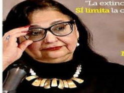
Norma Piña, Ministra

Los fideicomisos NO son para el pago de prestaciones de Ministros y Ministros