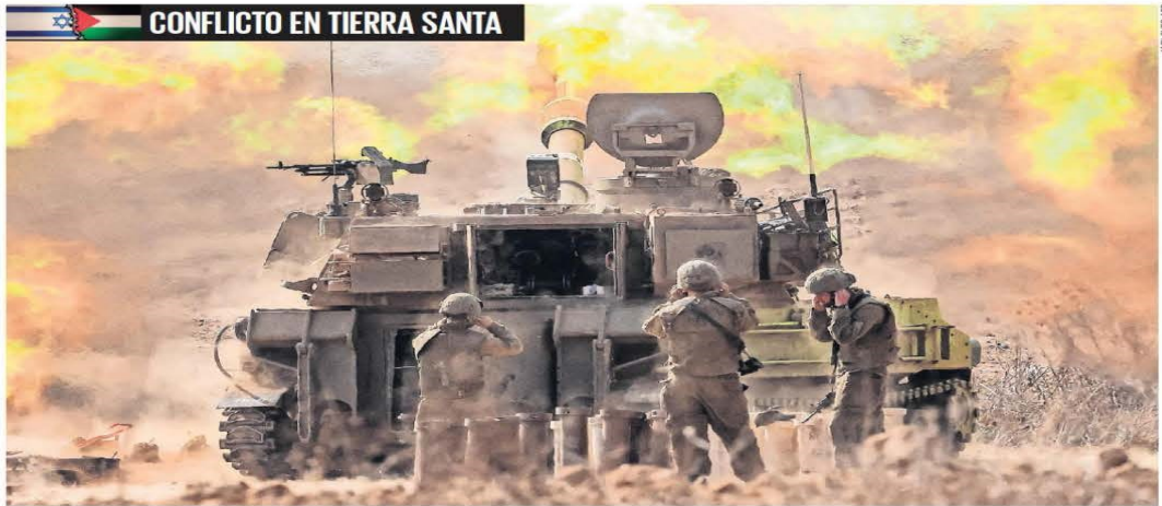
Un obús autopropulsado israelí dispara desde la frontera sur contra posiciones en Gaza, controlada por el grupo islamista Hamas, al que Netanyahu prometió acabar.