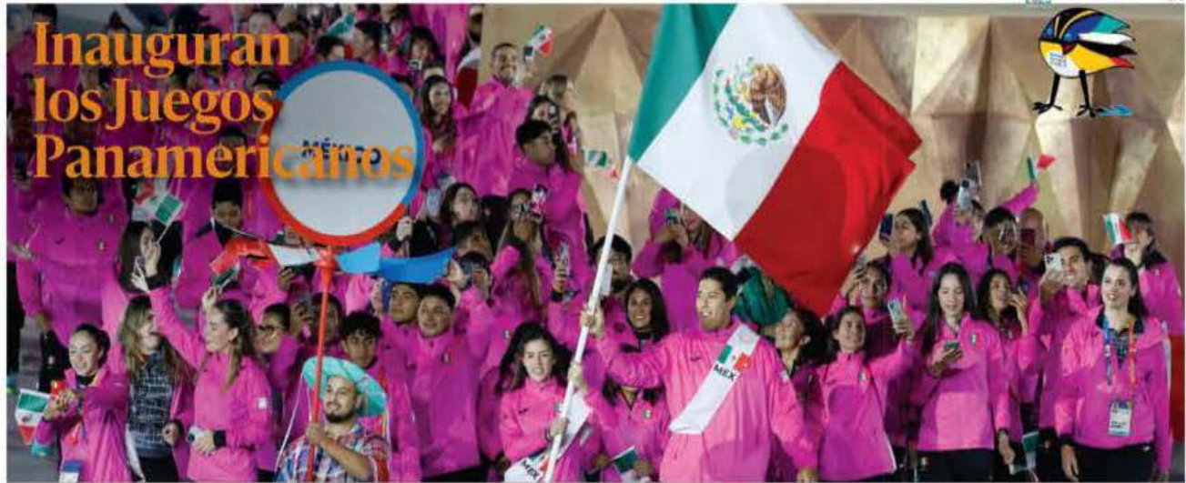
La noche de este viernes fueron inaugurados los Juegos Panamericanos Santiago 2023, en el estadio Nacional de la capital chilena, donde destacó una nutrida delegación mexicana que buscará colgarse varias medallas en esta aventura que tiene al deporte como lenguaje universal. PAG 22

PRESIDENTE DEL CONSEJO DE ADMINISTRACIÓN: JORGE KAHWAGI GASTINE // DIRECTOR GENERAL: RAFAEL GARCÍA GARZA // AÑO 27 // N.º 9,768 $10.00 // SÁBADO 21 OCTUBRE 2023 // WWW.CRONICA.COM.MX