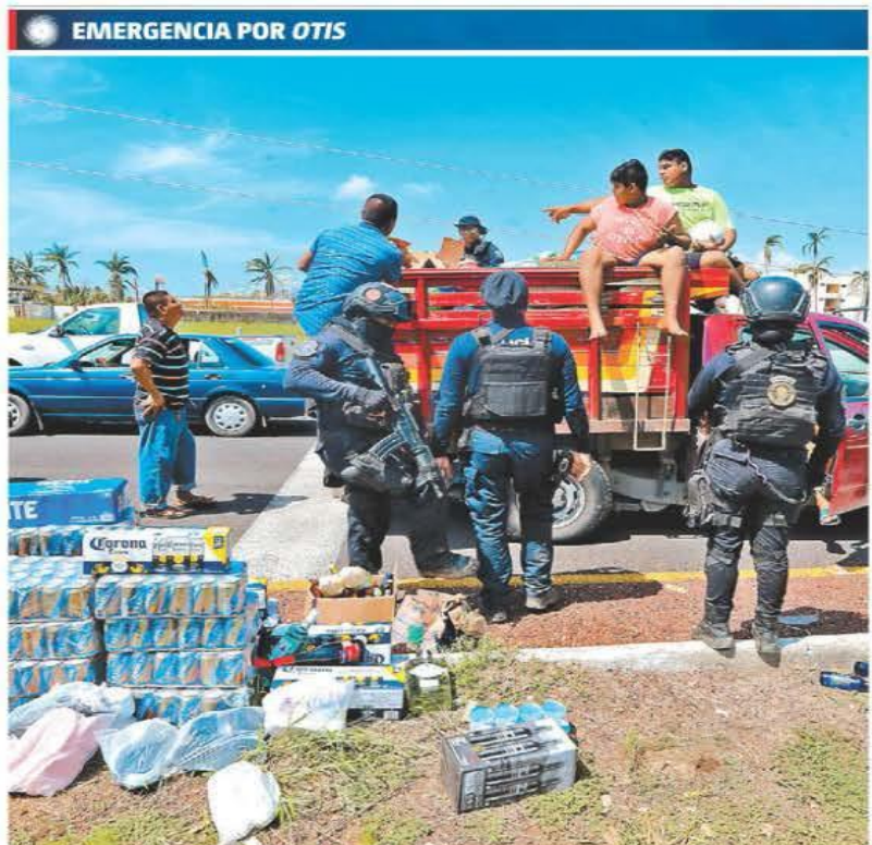
Policías impidieron que se aprovechara la emergencia para el robo de cerveza. JORGE CARBALLO

A. Pérez-Reverte "Qué va a saber de eso una tía", era la idea P. 22