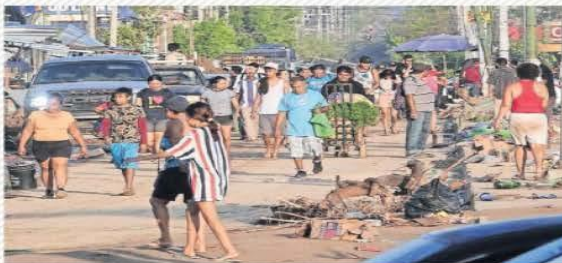
Residentes y turistas caminan entre los escombros, palmeras derribadas y vehículos dañados por el huracán.