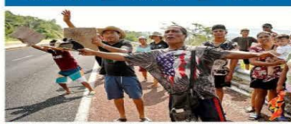
Personas afectadas por "Otis" piden ayuda en una carretera.