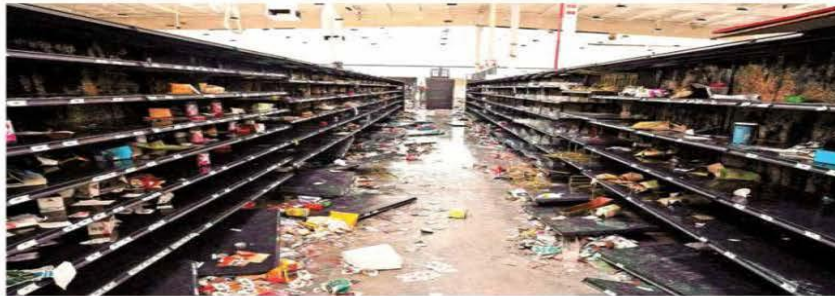
UNOS SE VAN Y OTROS... Un supermercado en Acapulco luce arrasado por la rapiña, que ayer incluyó el robo de adornos navideños. El puente aéreo para llevar ayuda y evacuar a turistas quedó listo