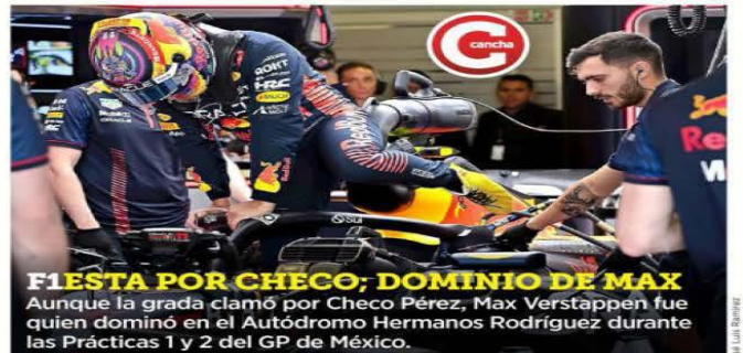
Fiesta por Checo; dominio de Max Aunque la grada clamó por Checo Pérez, Max Verstappen fue quien dominó en el Autódromo Hermanos Rodríguez durante las Prácticas 1 y 2 del GP de México.

Pemex reconoció que el alto endeudamiento pone en riesgo sus operaciones y su capacidad para pagar por cuenta propia.