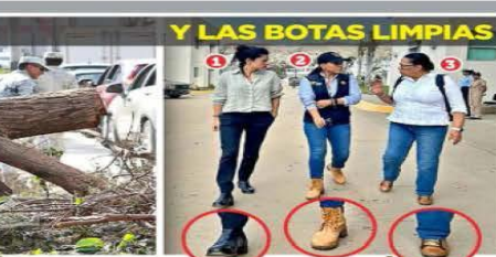
Y LAS BOTAS LIMPIAS

La titular de Segob, Luisa María Alcalde, postuló ayer a las 17:37 horas que tras un recorrido "los caminos ya están prácticamente restablecidos y las calles transitables". A esa hora, mujeres del Ejército trabajaban en quitar escombros. Tras su recorrido, las botas de ella (1), de la Gobernadora Evelyn Salgado (2) y de la titular de Seguridad, Rosa Icela Rodríguez (3), lucían completamente limpias.