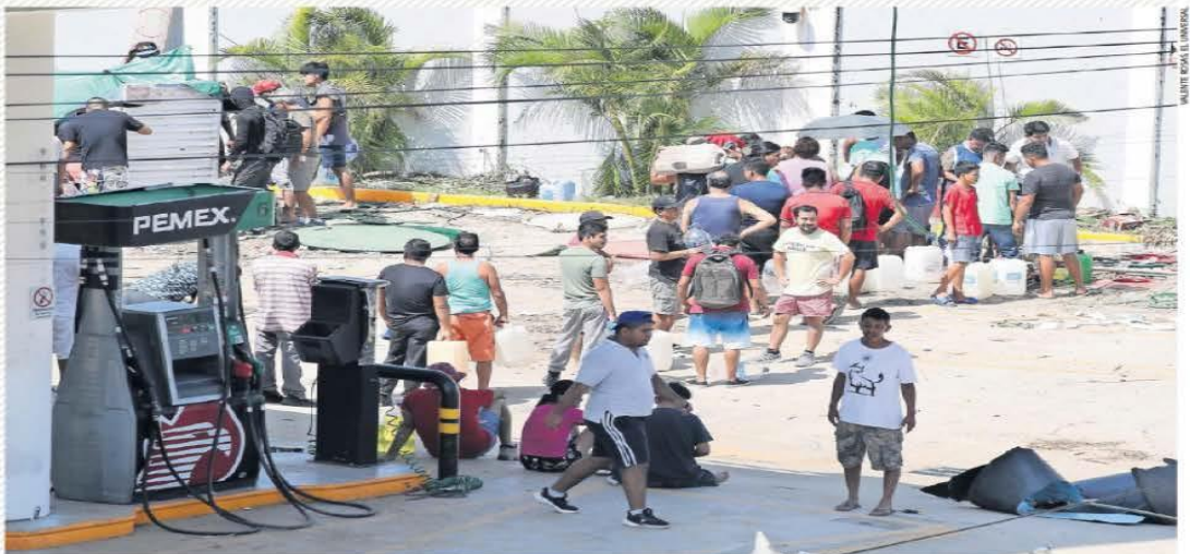
Hay gente que pasa hasta cuatro horas formada para extraer de forma ilegal gasolina de las estaciones de servicio y poder llenar un garrafón de 10 litros.