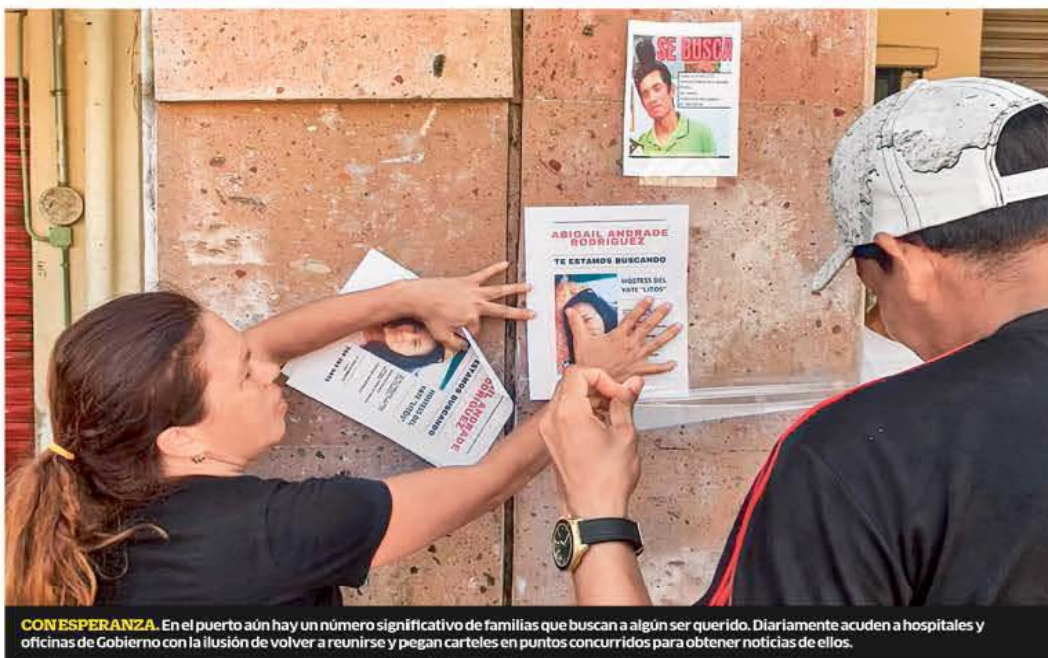
CON ESPERANZA. En el puerto aún hay un número significativo de familias que buscan a algún ser querido. Diariamente acuden a hospitales y oficinas de Gobierno con la ilusión de volver a reunirse y pegan carteles en puntos concurridos para obtener noticias de ellos.