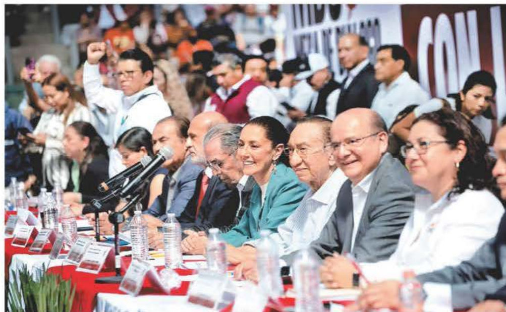
La aspirante se reunió en la Sala de Armas de la Magdalena Mixhuca con líderes gremiales de IMSS, Telmex, Metro y CROC. ESPECIAL

Claudia ofrece a sindicalistas ampliar más el salario mínimo