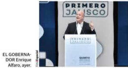
EL GOBERNADOR Enrique Alfaro, ayer.

"No vamos a fallar en los tiempos por venir": Alfaro