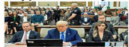
■ La Fiscal de NY acusó a Trump de manipular estados financieros para estafar a bancos y aseguradoras.

Mandatario, que duró aproximadamente cuatro horas, contenía reiterados comentarios fuera de lugar y quejas sobre el caso, sobre la Fiscal y el juez que decidirá el fallo, Arthur E. Engoron.