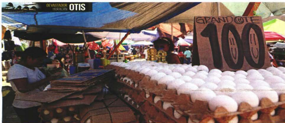
En el mercado el cartón de huevo se llega a vender en 100 pesos; pobladores señalan que faltan productos básicos y los que hay registran alza de precios.