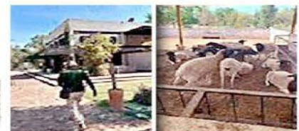
■ Ganado y lujos hallados en un rancho de Hidalgo que fue ligado al cartel inmobiliario de la Alcaldía Benito Juárez.