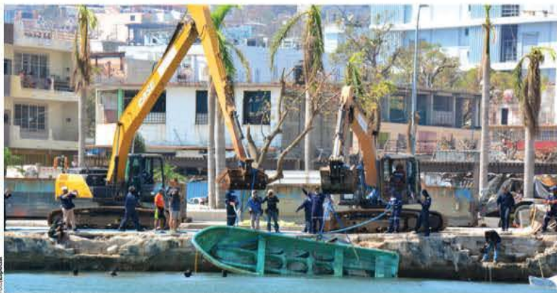
ELEMENTOS de la Marina recuperan ayer una lancha en el Malecón.

LA GOBERNADORA de Guerrero entregó ayer apoyos casa por casa.