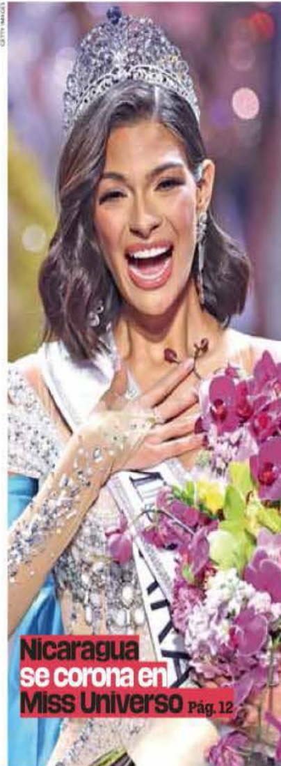
Nicaragua se corona en Miss Universo Pág. 12

Sustento. Se fundamenta en la inconstitucionalidad del sistema actual, respaldada por normas internacionales de derechos humanos y el fallo reciente de la SCJN. Pág. 04