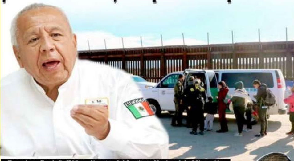
Francisco Garduño Yáñez, director del Instituto Nacional de Migración

y detiene extranjeros para ser repatriados