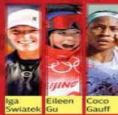
Iga Swiatek, Eileen Gu, Coco Gauff

El próximo año, los ingresos del deporte femenino a nivel global superarán, por primera vez, los mil millones de dólares.