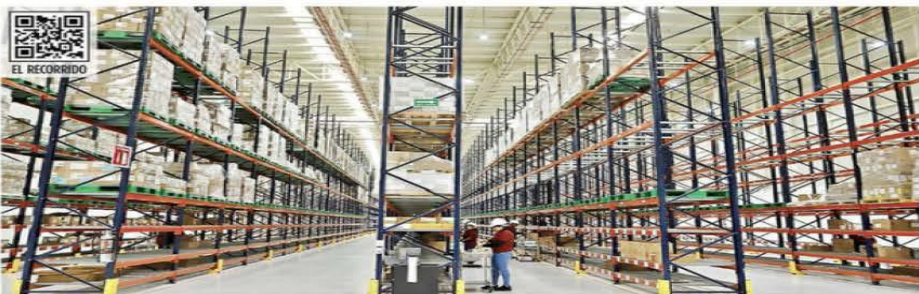
Los anaqueles de la megafarmacia, ubicada en Huehuetoca, Edomex, lucieron a la mitad.