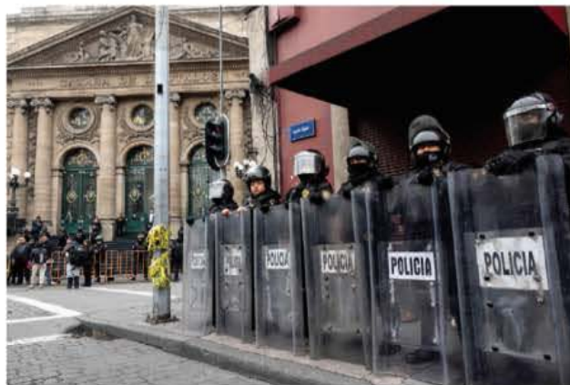
POLICÍA capitalina blinda ayer la Cámara de Diputados local.

Oradores de la 4T hacen tiempo para no llegar a la votación que sería adversa; PAN acusa "machincuepas"; retomarían discusión en periodo extra pág. 16