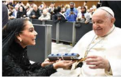
EL PAPA Francisco, con la gobernadora de Quintana Roo, ayer.

ENTREGA gobernadora de Q. Roo al Pontífice carta de AMLO y una réplica del ferrocarril que será inaugurado mañana; realiza gira en Italia para promover turismo en su entidad. pág. 10