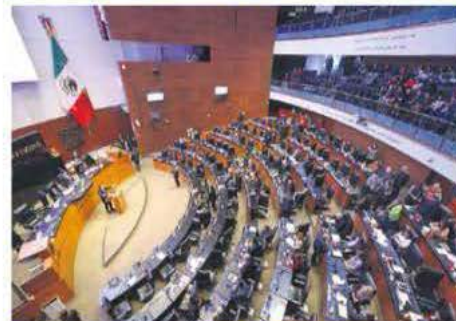
Sin acuerdos. Rechazan la segunda terna para sustituir a Arturo Zaldívar.

su voto al nombramiento de dos magistrados electorales que están pendientes. Tras el rechazo de la segunda terna, ahora —según la Constitución— el presidente deberá designar ministra a alguien de esta terna. —Eduardo Ortega / PÁG. 38