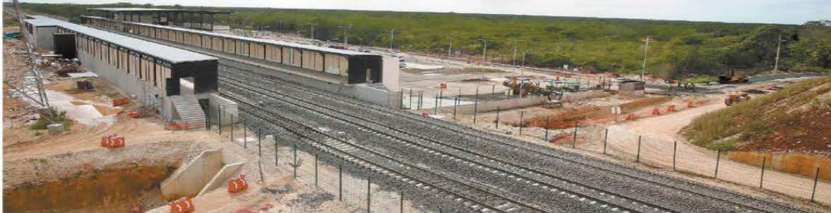
Pobladores y activistas señalan que el presidente López Obrador sólo inaugurará las vías, porque estaciones, como la de Calkiní, todavía no están terminadas.

hecho por EL UNIVERSAL, se constató que hay vías inconclusas y señalética faltante. En las estaciones y vías se carece de infraestructura peatonal, ciclista y de accesos, así como de instalaciones y escaleras eléctricas. | A4 Y A5 |