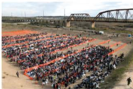
EXODO de migrantes hacia Eagle Pass, donde son detenidos.

En México Gobierno cambia estrategia; hace grupos de trabajo para mejorar atención, gestión de flujos irregulares y movilidad laboral; para algunos indocumentados el país ya es su Plan A. págs. 4, 5 y 21