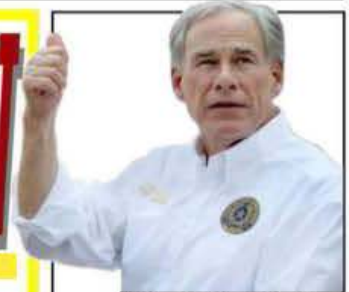
Gobernador de Texas, Greg Abbott

Senador Abbott acusa a AMLO de someter a personas a tortura, violación y muerte