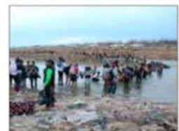
En Piedras Negras, Coahuila, cientos de indocumentados buscan atravesar el río Bravo para llegar a EU.