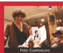
MUERE CRISTINA PACHECO; DIO VOZ A LOS DE ABAJO

A unos días de la Navidad, los precios de alimentos siguen al alza y en la mayoría de las familias mexicanas habrá una triste celebración. El INEGI advierte sobre el alza en la inflación subyacente, que encarece los productos básicos. ▶ 12