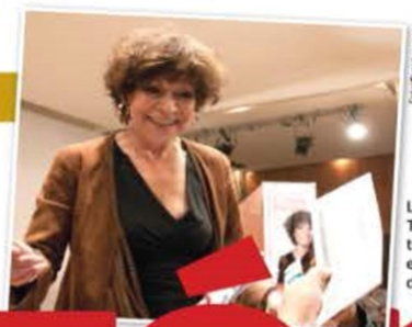
LA PERIODISTA, en una fotografía de 2011 en el Palacio de Bellas Artes.

LA TAMBIÉN escritora fallece a los 82 años; dio voz a personas del pueblo a través de Aquí nos tocó vivir ; retrató a profundidad personajes en Conversando con y dio vuelo a su pluma en Mar de historias . págs. 26 y 27