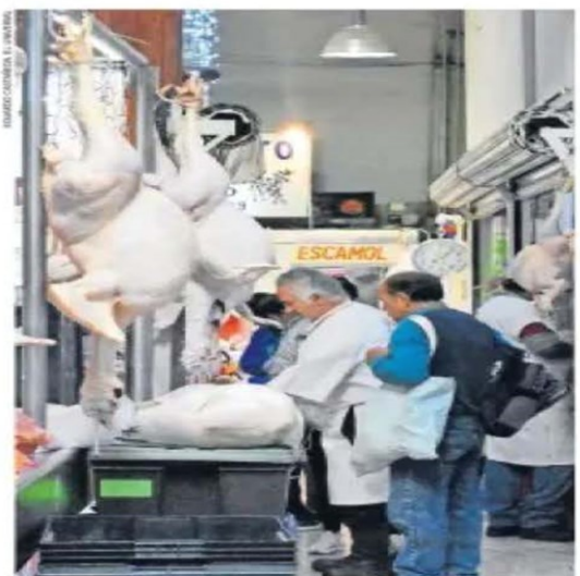
El Consejo Mexicano de la Carne dio a conocer que el kilo de pavo de importación se encareció 11% durante el último año.

Alimentos tienen un alza en precios de hasta 56% en la primera mitad de diciembre, reporta Inegi