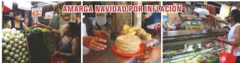
AMARGA NAVIDAD POR INFLACIÓN