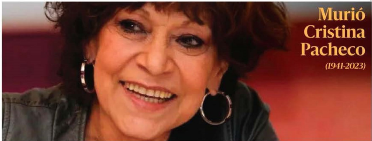
Murió Cristina Pacheco (1941-2023)