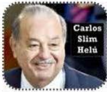
Carlos Slim Helú

REVELAN CONTRATO que Segalmex firmó con Telmex para cerrar 2023