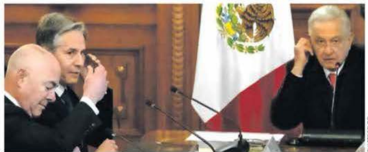
En plena crisis. Delegaciones definen reuniones periódicas, trabajar con Centro y Sudamérica, y dar soluciones regionales.