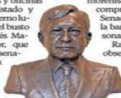
Obra de Ramírez Ponzanelli entregada a Hacienda.

Los bustos que fueron comprados por los legisladores morenistas son