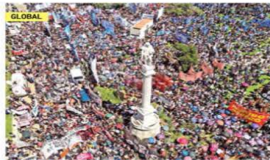
MILES PROTESTAN EN ARGENTINA

FUNCION, PRIMERA, DINERO, COMUNIDAD, GLOBAL, EXPRESIONES Y ADRENALINA