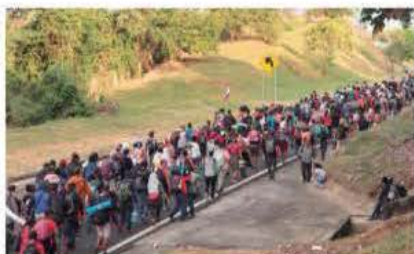
CARAVANA migrante, ayer rumbo a Escuintla, Chiapas.

Lanzan SOS Chicago, Denver, NY y Eagle Pass porque están rebasados; éxodo llega a Escuintla; Senado debe protestar frente a leyes que criminalizan a indocumentados: Monreal