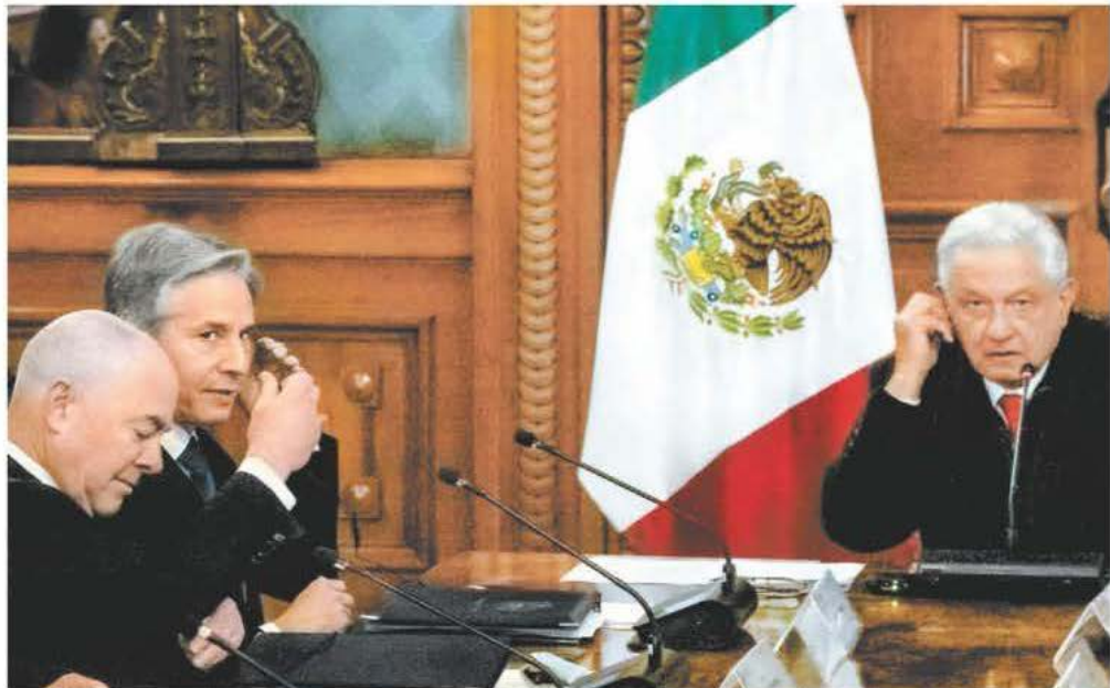
Alejandro Mayorkas y Antony Blinken, secretarios de Seguridad y de Estado de EU, con López Obrador.