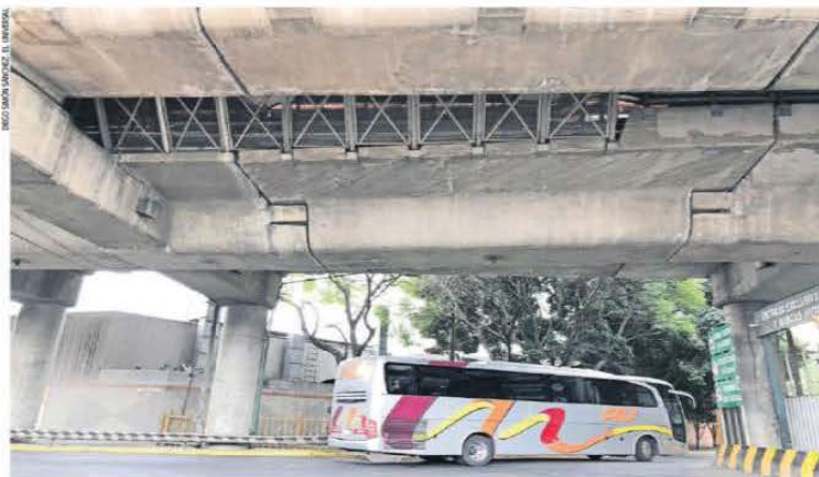
IMAGEN DEL DÍA DARÁN ARREGLADITA A LÍNEA B

Ante los hundimientos y para evitar vibraciones, cuatro de las 21 estaciones de esta línea del Metro serán intervenidas para renivelar sus vías. Las obras iniciarán el 18 de enero y se prolongarán durante cinco meses, en los cuales se trabajará de madrugada, por lo que no se suspenderá el servicio. | METROPOLI | A13