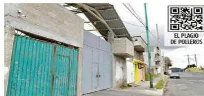
En esta bodega de la Colonia Parques Nacionales, en Toluca, presuntamente fueron secuestrados trabajadores de una empresa de pollo, el fin de semana pasado.

"Terminas siendo parte de todo este problema porque después no sólo es La Familia Michoacana la que cobra cuota. Yo como proveedor termino inflando precios a mis clientes para pagar la cuota, lo mismo que hago yo tienen que hacer otros compañeros pollos para que los dejen trabajar", expresó.