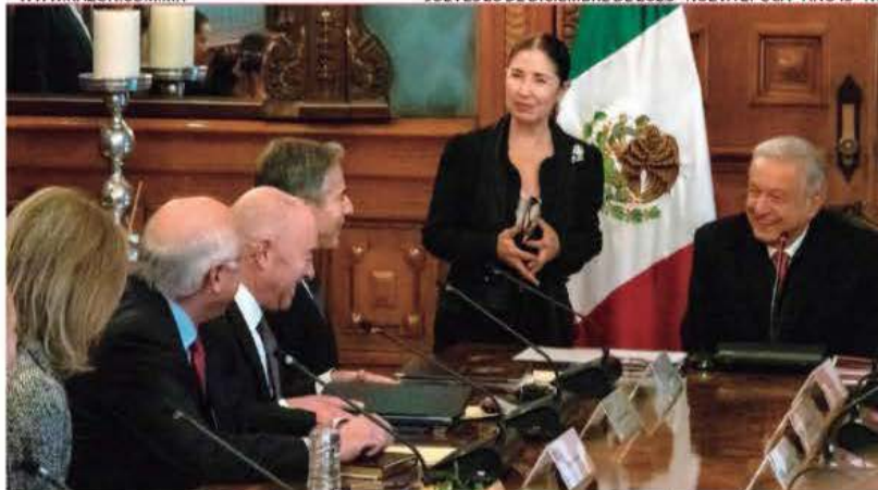
EL PRESIDENTE, ayer en Palacio con Elizabeth Sherwood-Randall, Ken Salazar, Alejandro Mayorkas y Antony Blinken.