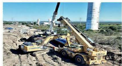
DUCTO SIN UNIR. Zanjas y tubería sin unir se captaron sobre el trayecto del acueducto a la altura de la Planta de Bombeo No. 2, en Los Ramones.

La Conagua reporta que el ducto está "bajo libranza", estatus que significa que se vació el ducto para realizar trabajos en la tubería, labores que se supone debieron concluir el pasado 16 de diciembre.