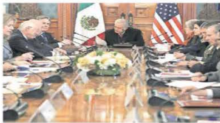
REUNIÓN FRENTE A LA MIGRACIÓN

El presidente Andrés Manuel López Obrador se reunió con una delegación de Estados Unidos, en la que pactaron trabajar en conjunto con países de Centro y Sudamérica para atender la migración ilegal. El secretario de Estado, Antony Blinken, destacó los esfuerzos compartidos y el mexicano dijo que es indispensable la política de buena vecindad. | A6 |