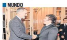
ILUSTRACIÓN: LUISA PEDRAZA