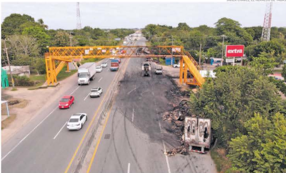
JAVIER CHÁVEZ, EL HERALDO DE TABASCO

Grupos armados quemaron al menos 15 vehículos en varios puntos del estado y las entradas a Villahermosa