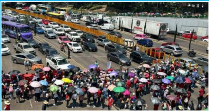
Maestros de la CNTE bloquearon Circuito Interior provocando caos vial en la CDMX

Milenio Diario (6), El Financiero (5), Reforma (4), Excélsior (4), El Universal (3), El Heraldo de México (3), La Jornada (2), 24 Horas (2), ContraRepública (2), Reporte Índigo (2), El Independiente (2), El País (2), El Economista (1), El Sol de México (1), La Crónica de Hoy (1), La Razón de México (1), Diario de México (1), Unomásuno (1), Diario Imagen (1) y Ovaciones (1)