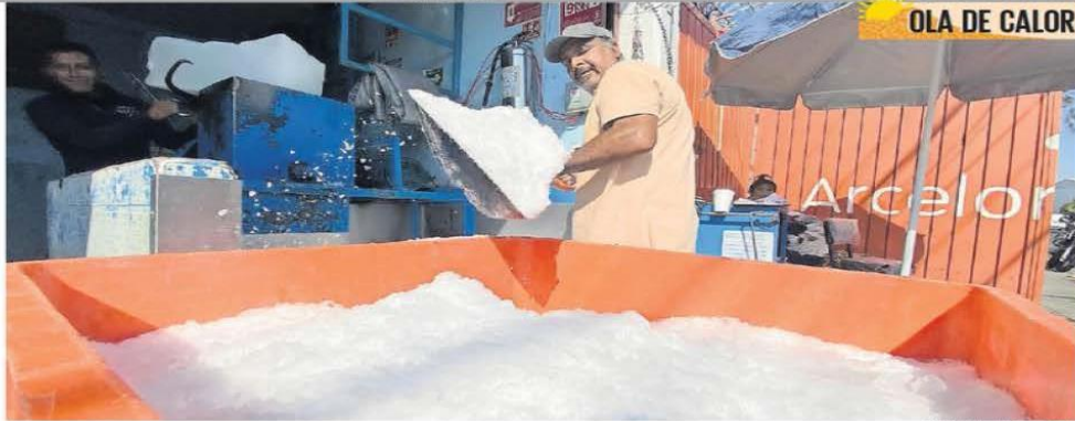
ARLEN CARLOS WILLIAMS/EL UNIVERSAL