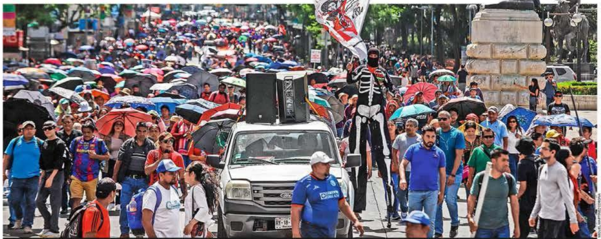
INFIERNO DE ASFALTO. Además de las elevadas temperaturas, profesores agremiados a la CNTE provocaron un severo caos vial que atrapó a los automovilistas por horas CDMX P. 6

ADVIERTE SINDICATO DEL METRO IRREGULARIDADES EN LA L-12 CDMX P. 6