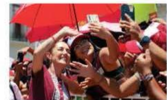
CLAUDIA Sheinbaum, ayer en Durango.

SHEINBAUM minimiza manifestación de Marea Rosa y firma de intelectuales; considera que eso no impacta en sentido del voto.