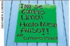
Centros de acopio de limón se mantienen cerrados.

3% ES LA META ANUAL DE INFLACIÓN que tienen los bancos centrales de ambos países.