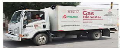
Operadores del programa Gas Bienestar, que arrancó en 2021, han denunciado las condiciones laborales.

"Actualmente en Gas Bienestar no se tiene asignado un presupuesto para el canje de cilindros, tampoco un presupuesto asignado, pues opera con recursos pro-