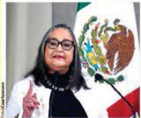
LA PRESIDENTA de la Suprema Corte, ayer.

SUBRAYA importancia de diagnóstico sobre implicaciones de perder baluarte, un derecho del pueblo; Ejecutivo acusa "sabadazo" por liberación de Marín. pág. 7