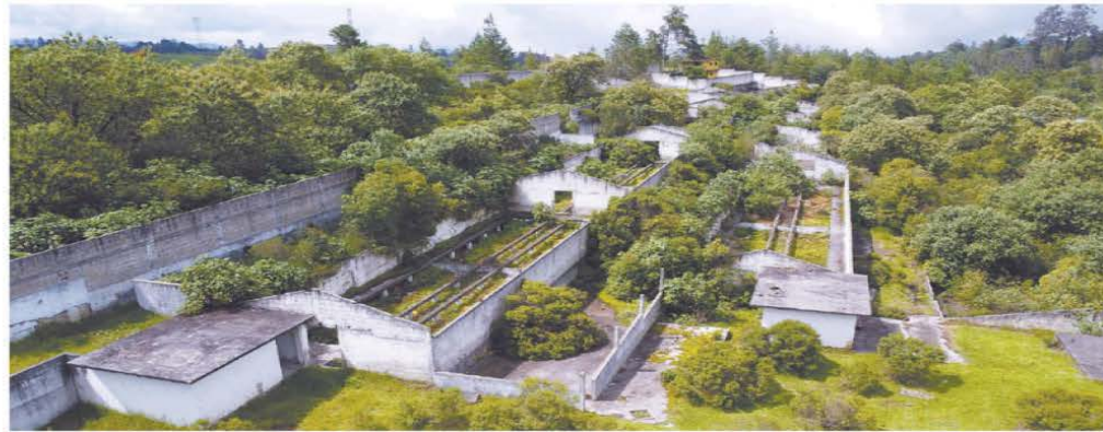
De la finca de los hermanos Zambada sólo quedan estructuras de concreto abandonadas y deterioradas, visitadas por algunos curiosos.

Los habitantes recuerdan a los hermanos Zambada como buenas personas; AMLO, Sheinbaum y gobernadores de Morena defienden a Rubén Rocha de las acusaciones de Ismael Zambada