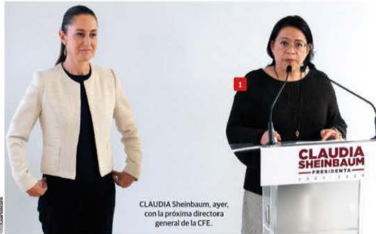
CLAUDIA Sheinbaum, ayer, con la próxima directora general de la CFE.

DESIGNA la virtual Presidenta electa a ingeniera electrónica; lleva 21 años de labor en la empresa; le encarga fortalecerla y elogia su capacidad estratégica.