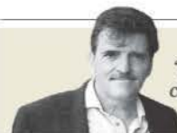
Enrique Serna "El trato al pueblo como eterno menor de edad" - P. 32

Precaución. EU emite alerta de viaje; Femsa baraja "medidas" en tiendas Oxxo en esa entidad y cierra planta en Morelos por episodios de violencia en Puente de Ixtla