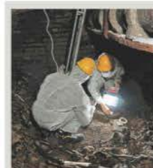
Desde el siglo XVII europeos se metían coca

Ataque en Morelia Granadazo: tardó 16 años el pago de indemnización ARTURO ÁNGEL - PÁG. 8