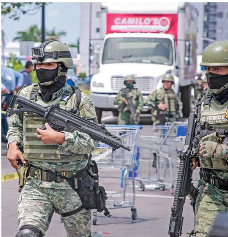
RESGUARDO. Elementos del Ejército y la Guardia Nacional vigilan las calles de la capital de Sinaloa, aunque pocos habitantes optaron por salir de sus domicilios ante la ola de violencia en la ciudad.

En lo que fue el cuarto día de narcoguerra en la capital de Sinaloa, el gobernador Rubén Rocha Moya anunció la cancelación de las Fiestas Patrias y la suspensión de clases, mientras que en redes sociales se mantienen las denuncias sobre ataques, levantones y tiroteos en diversos puntos de la ciudad, por lo que una parte de los ciudadanos se encuentra acuartelada en sus hogares. En tanto, en Nueva York, EU, El Mayo Zambada comparecerá hoy en un tribunal en el que será juzgado y escuchará la lectura de los cargos en su contra MÉXICO Y ESTADOS P. 6 Y 10