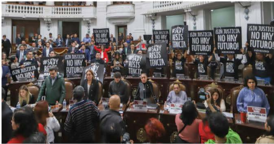
El Congreso de la Ciudad de México aprobó la Reforma al Poder Judicial tras una intensa sesión. PAG 14 y 15

PRESIDENTE DEL CONSEJO DE ADMINISTRACIÓN: JORGE KAHWAGI GASTINE // DIRECTOR GENERAL: RAFAEL GARCÍA GARZA // AÑO 28 N° 10.088 $10.00 // VIERNES 13 SEPTIEMBRE 2024 // WWW.CRONICA.COM.MX