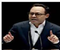
El senador de MC, Clemente Castañeda.

Pero, tanto el presidente del Senado, Gerardo Fernández Noroña, como el líder