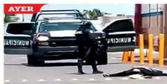
Tan sólo ayer, se reportaron 3 asesinatos, 2 heridos (uno de ellos militar) y 6 plagios.