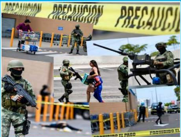
Culiacán continúa atravesando días de violencia extrema por la guerra entre facciones del Cártel de Sinaloa ; calles vacías, escuelas cerradas, negocios abandonados y asesinatos en plazas comerciales. El gobernador canceló los festejos por el Grito de Independencia, mientras Estados Unidos emitió una alerta para no viajar a la ciudad.

Reforma (25), El Financiero (23), El Universal (18), La Jornada (14), Excélsior (14), El Economista (8), El Heraldo de México (8), Milenio (7), La Razón de México (6), Unomásuno (6), El Independiente (6), La Crónica de Hoy (4), Diario de México (4), El Sol de México (3), ContraRéplica (3), La Prensa (3), 24 Horas (2), Reporte Índigo (2), Ovaciones (3), El Día (1), Diario Oficial de la Federación (1).