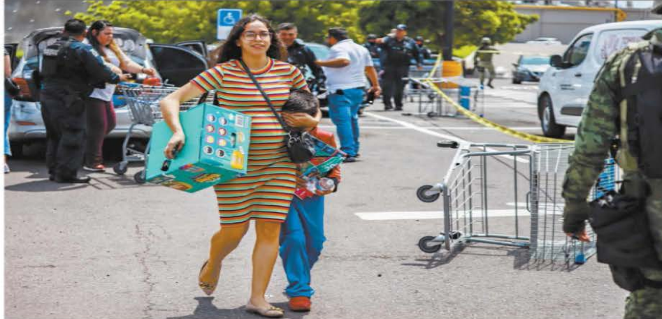
Una mujer le cubre los ojos a su hijo para que no vea el cadáver de un hombre asesinado a balazos en el estacionamiento de un supermercado en el sur de Culiacán.