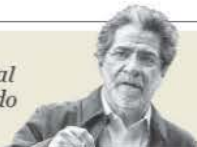
Rafael Pérez Gay "El centenario ahuehuete del Parque España" - P. 3