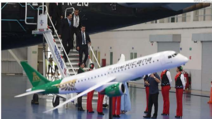
Con bombo y platillos Mexicana de Aviación, la aerolínea del Estado mexicano, presentó este viernes su nueva aeronave de fabricación brasileña Embraer E195 E2, con capacidad para 132 pasajeros y que se suma a la flota que ya ofrece servicio a 18 destinos del país. PAG. 7