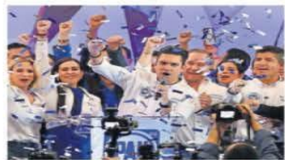
Jorge Romero asumirá la presidencia del Partido Acción Nacional para el periodo 2024-2028.