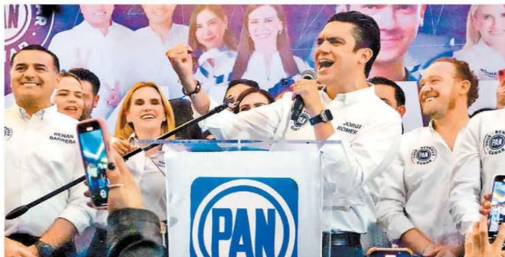
El ex diputado celebra con colaboradores y seguidores en un hotel de Ciudad de México.