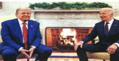
"Bienvenido de nuevo" le dijo el presidente de Estados Unidos a su sucesor republicano, luego de recibirlo en el Despacho Oval.