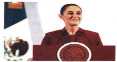
La presidenta Claudia Sheinbaum explicó que el nuevo régimen se incluirá en el Paquete Económico 2025.

Expuso que habrá un incremento de la productividad y eficiencia operativa para alcanzar