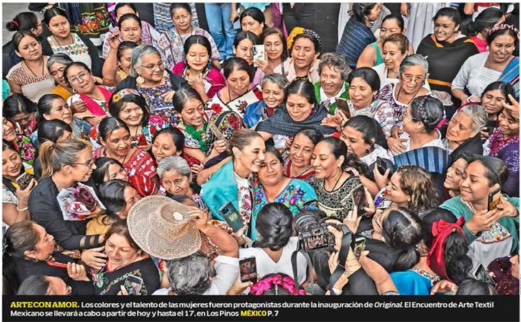
ARTECONAMOR. Los colores y el talento de las mujeres fueron protagonistas durante la inauguración de Original. El Encuentro de Arte Textil Mexicano se llevará a cabo a partir de hoy y hasta el 17, en Los Pinos. MÉXICO P. 7

PEMEX TENDRÁ NUEVO RÉGIMEN FISCAL DE OPERACIÓN EN 2025 NEGOCIOS P. 15