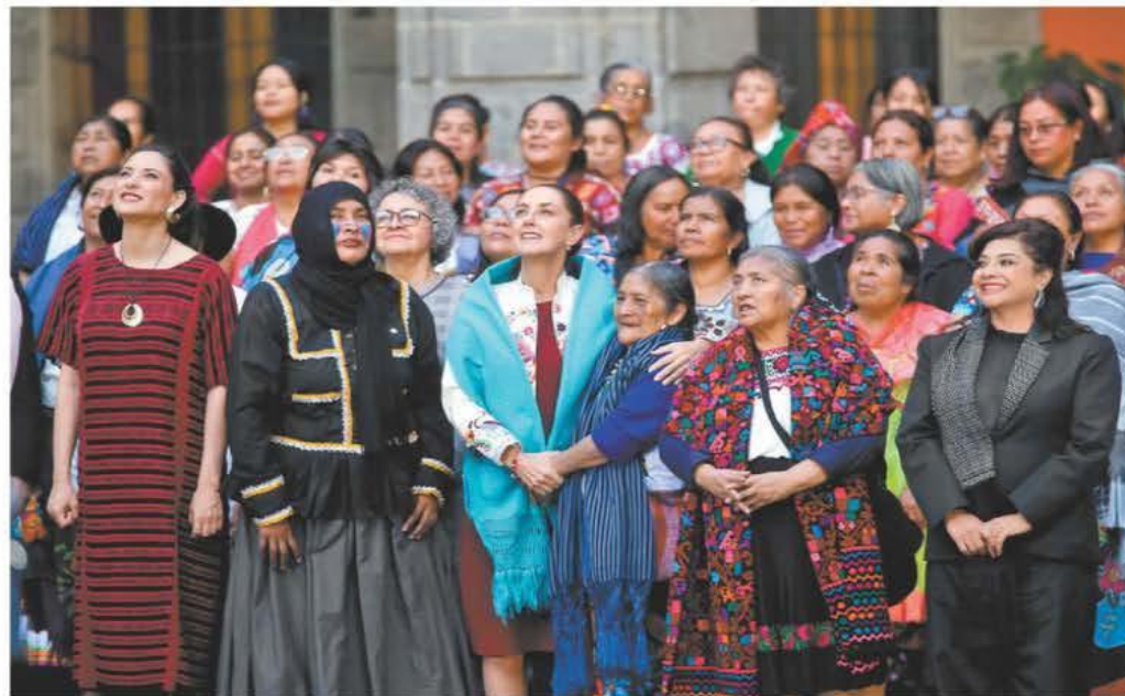
La mandataria y Clara Brugada durante el Encuentro de Arte Textil Mexicano en el patio central de Palacio Nacional. ARACELI LÓPEZ