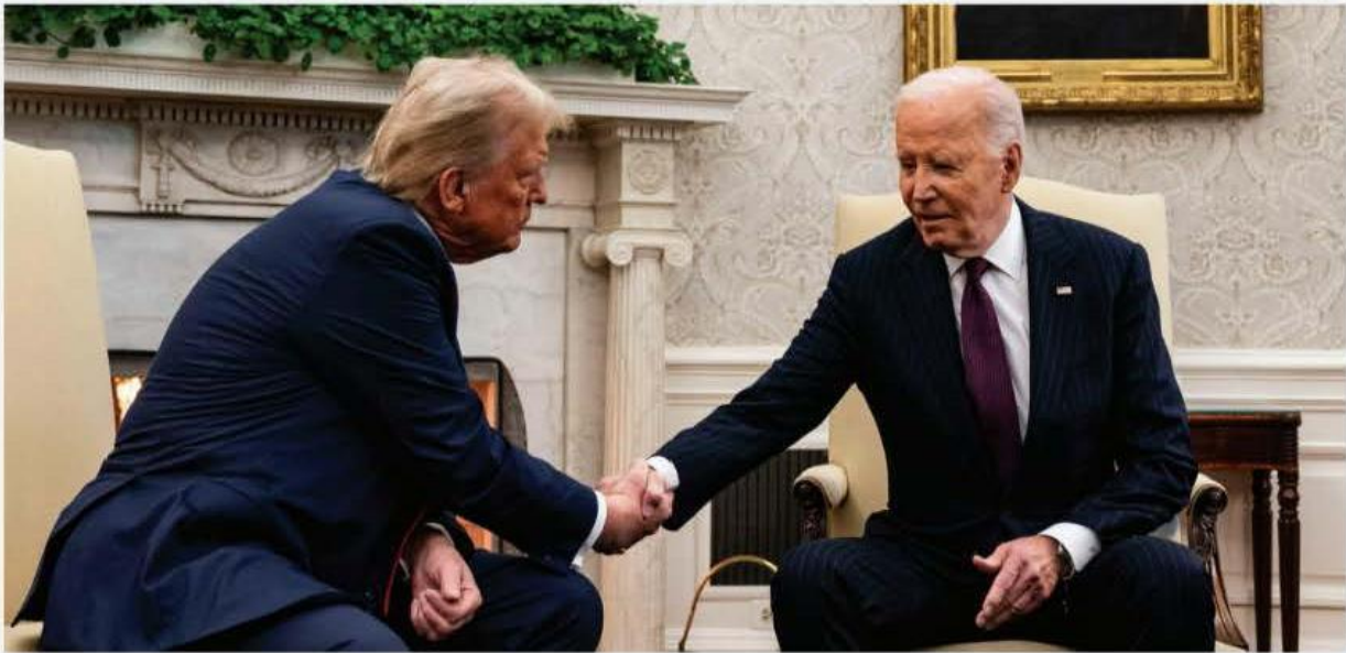
BIDEN OFRECE TRANSICIÓN ORDENADA A TRUMP. PAG. 20