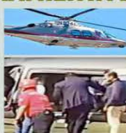
El legislador de Morena Pedro Haces dice que siempre ha usado helicóptero. "Trabajo por cielo, mar y tierra", presume.

Haces Barba dirige la Confederación Autónoma de Trabajadores y Empleados de México (CATEM) desde hace 15 años y recientemente fue reelecto como líder hasta el 2030.