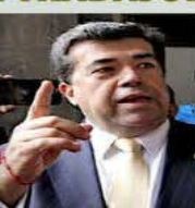
Montiel comentó que no presentará ningún informe sobre los traslados que ha realizado en aeronaves privadas.

"No tiene nada que ver con mi trabajo, ya no había sesión, era un asunto que no tiene que ver con recursos públicos, con el uso de aparatos oficiales o