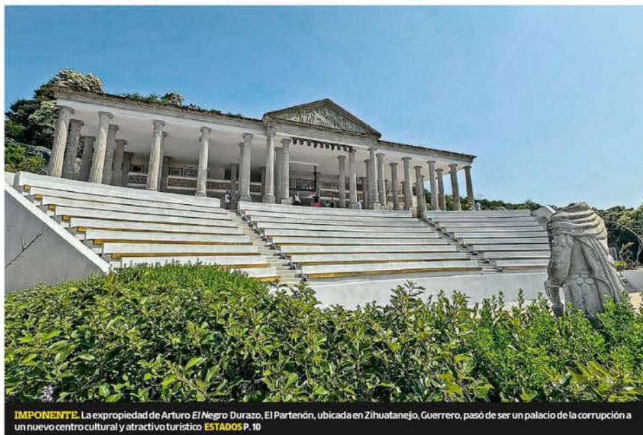
IMPONENTE. La expropiación de Arturo El Negro Durazo. El Partenón, ubicada en Zihuatanejo, Guerrero, pasó de ser un palacio de la corrupción a un nuevo centro cultural y atractivo turístico ESTADOS P. 10

PREVÉN HASTA 165 MIL MDP DE DERRAMA POR PUENTE Y EL BUEN FIN NEGOCIOS P. 15