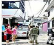
Ayer fue ejecutado en el Puerto un taxista y en otro incidente, 3 personas resultaron heridas.

cifra de asesinatos es de 572. Especialistas e inversionistas urgen a rescatar el puerto, pues la violencia frena la actividad económica y se suma a los daños por los desastres naturales. Desde hace por lo menos una década, la ciudad arrastra omisiones de sus autoridades en obras hidráulicas y red de drenaje que abonan a