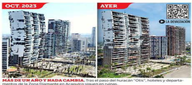
MÁS DE UN AÑO Y NADA CAMBIA. Tras el paso del huracán "Otis", hoteles y departamentos de la Zona Diamante en Acapulco siguen en ruinas.