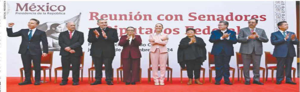
En el podio, junto a Sheinbaum, estuvieron Manuel Velasco, Alberto Anaya, Adán Augusto López, Rosa Isela Rodríguez, Ernestina Godoy, Ricardo Monreal, Reginaldo Sandoval y Carlos Puente.