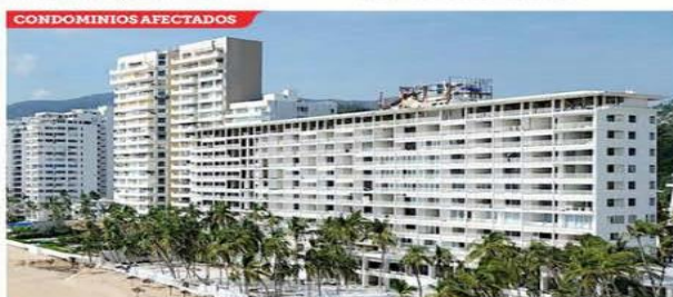
■ Una buena parte de los departamentos aún no han sido remodelados.