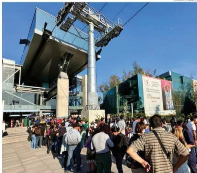
Largas filas en la Línea 3 del Cablebús, donde la espera es de 50 minutos para abordar una cabina

¿Ya sabe cómo votará en la elección judicial? - P4