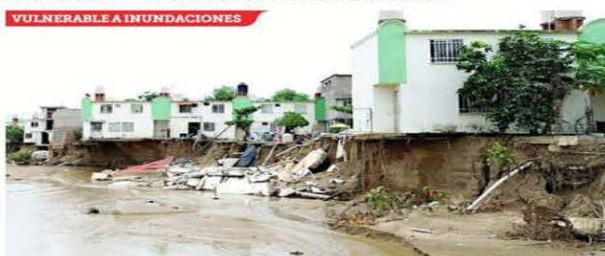
■ Varias colonias se encuentran en zonas cercanas a ríos y otros cauces de agua.

pulco está afectado. Lo que había de formalidad pasó a la informalidad con ingresos bajos e inestables. Los meseros se han convertido en tianguistas, las camareras venden fritangas y el trabajador turístico se ofrece para chambas urgentes, advirtió el sociólogo y urbanista Carlos Flores Rico.