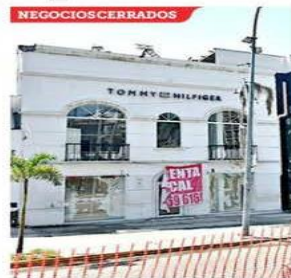
■ La actividad comercial también se ha visto afectada en el destino turístico.