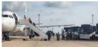
Imagen de deportaciones de migrantes que fueron repatriados desde EU hacia sus países de origen

A dos meses para que regrese a la presidencia de Estados Unidos e inicie su promesa de expulsiones masivas de migrantes indocumentados, Donald Trump ya avanza en sus planes y para ello su equipo antiinmigrante ya gestiona la construcción o ampliación de grandes centros donde se llevará a los sin papeles previo a su expulsión, según reportó la cadena CNN, que cita fuentes cercanas a este proyecto. Una de las opciones es am-