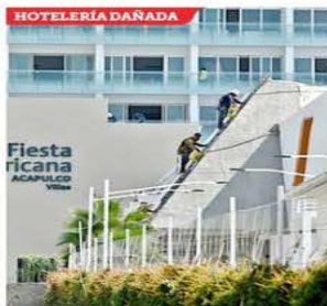
■ Según datos de hoteleros, aún falta la mitad de habitaciones por habilitarse.