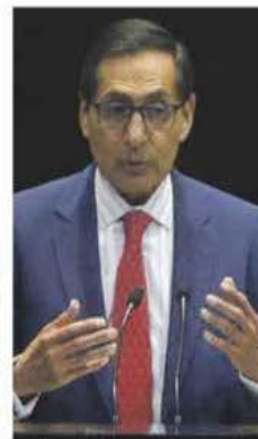
Ramírez de la O. Planteamiento gradual para lograr la consolidación fiscal.

También defendió la proyección de crecimiento planteada en el Presupuesto de entre 2 y 3 por ciento para 2025, pues es una previsión responsable, dijo, fundamentada en el empleo y mercado interno, con el consumo e inversión como motores. —Felipe Gazzón / PÁG. 4