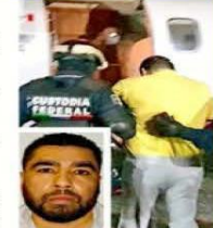
LO QUIERE EU. "El Contador" fue detenido en febrero de 2022.

Hasta la semana pasada, se habían notificado 572 amparos y 366 suspensiones