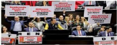
La Oposición reprochó al titular de Hacienda, los recortes en Salud y Educación.

En cuanto a la inversión, confió en que será potenciada por proyectos con la iniciativa privada y la relocali-