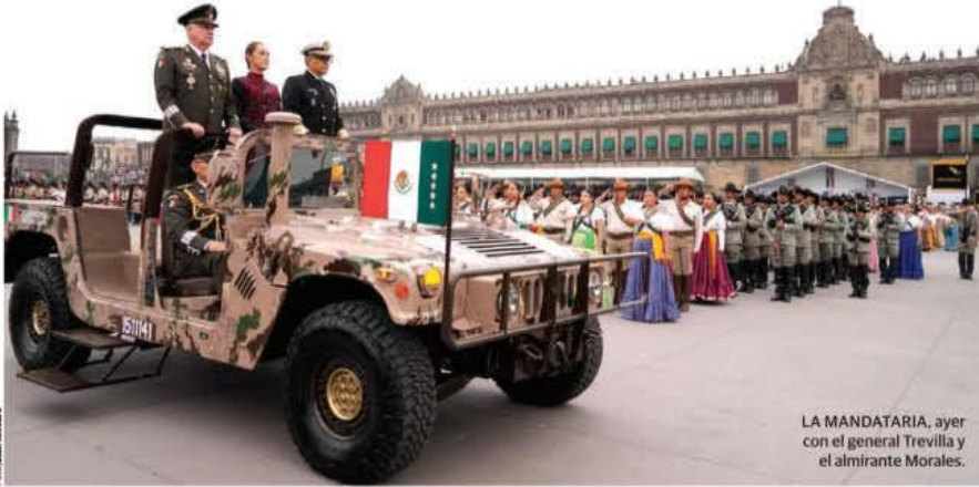
LA MANDATARIA, ayer con el general Trevilla y el almirante Morales.

SHEINBAUM destaca en el 114 aniversario del inicio de la Revolución las transformaciones; asegura que México es visto con admiración en el mundo; destaca apoyo de Fuerzas Armadas en seguridad y obras; éstas refrendan lealtad a la Presidenta y a la nación; cientos de familias aplauden a contingentes. pág. 12