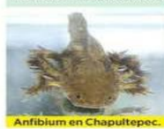
Anfibio en Chapultepec.

Mientras los investigadores buscan recuperar su hábitat natural, en museos prolifera la exhibición de axolotes.